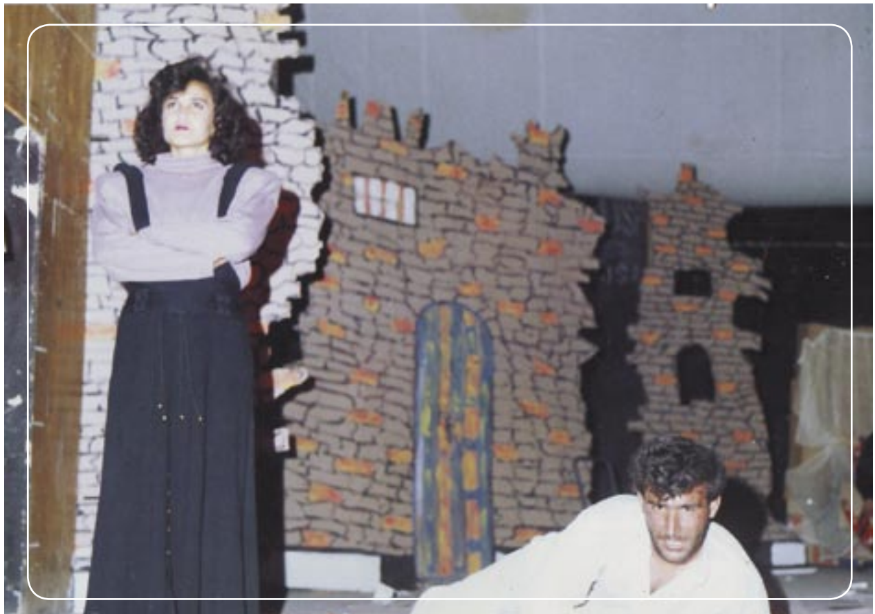
شانۆى ھەولير) گۆفاريكى شانۆيە دووم فيستيفالى نيودەولەتى ھەولير بۆ شانۆ دەریدەكات

ئيشكردنى ژيلوان تاهير لەناو تيکستەكانى بيكت نەيتوانى ئەو دیدە بگۆريت كە مەھدى حەسەن دەرى خست، بەواتاى ئەو دارشتمەيەكى تری بە بيكت نەبەخشی، بەقەد ئەوھى وای ليھات تيکستەكانى شانۆى ئەبسىرد بۆ شانۆكارانى ھەولير بوو بە فۆرميک كە ئەوھ بە فۆرمى نوئ بۆ شانۆ سەير بکەين، ديارە ئەوھش وەك شانۆيەك ھىندەى لەناو سوونەتگەرايى خۆى دەخنكاند، تواناى كەشف كردنى جیھانى نوئى شانۆيى نەبوو، بۆيە ليكچوون بوو بەخالتيكى زۆربەى نيوان ئەو دەرھينەرەنە، لەكاتيكا ئەوان لەسەر ئەو ليكچوونە كارەكانيان زياتر لەيەكى نزيك دەكردنەوھ، كە دەبوو ئەوھى لەيەكتريان نزيك بكاتەوھ تەنھا دنياى نوسەرەكان