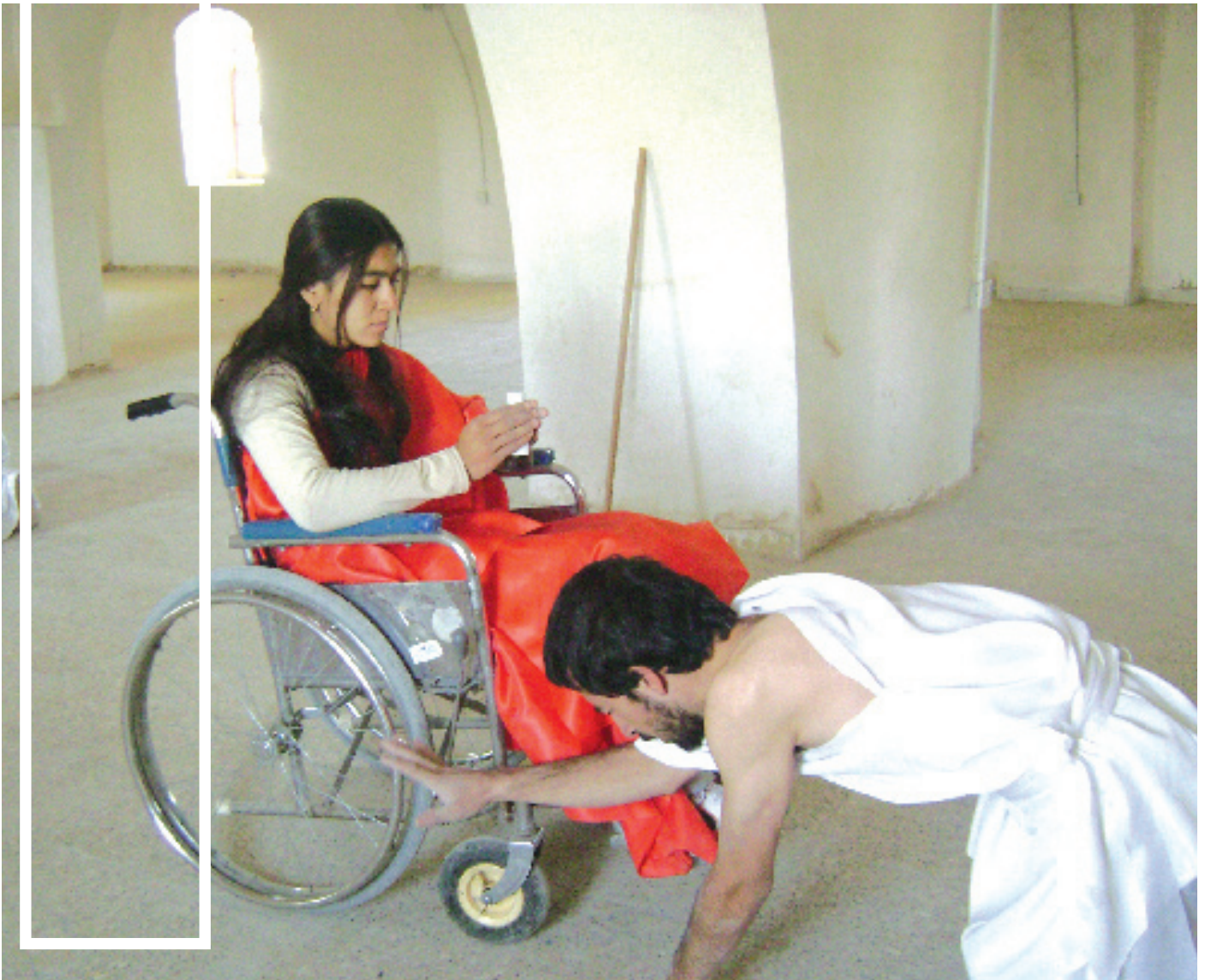
گه‌ران به‌دوای ئاشکراکردنی نه‌ینی

به‌لکو ئیدی شانۆی که‌رکوک له‌ناو شانۆیه‌کی ته‌زمونگه‌ری توانای ته‌وه‌ی هه‌یه ته‌زمونی جدی و جیاواز بنیات بنیت، به‌ دلنیا‌یه‌وه ته‌ گه‌ر ته‌وه‌هه‌ولانه‌ رێک بخریت، ته‌وا ته‌مجاریان شانۆ له‌ کوردستان له‌ که‌رکوک‌وه سه‌رده‌می گه‌شی خۆی ده‌ژێتته‌وه، ئیره‌ ده‌ییت به‌ پایته‌ختی شانۆی کوردی، به‌لام ته‌وه‌ کاره‌ پێوستی به‌ هاوکاری زۆر هه‌یه چ له‌ نیوان شانۆکاران خۆمان یاخود له‌ لایان ده‌زگا به‌رپرسه‌کان، ته‌وه‌یان به‌ته‌نیا خه‌ونیک نیه، ئیمه‌ خه‌ریکی نووسینی پرۆژه‌ی ستراتیژی شانۆین، ته‌ گه‌ر هاوکاریش نه‌کرین ده‌کرێ به‌دوای میکانیزمی تر بو ته‌وه‌ پرۆژه‌یه‌ بگه‌رێین، له‌کاتی خۆشی پرۆژه‌ی ستراتیژی ئیمه‌ بو شانۆ ده‌خریتته‌ روو، به‌ شیوه‌یه‌ی شیاو ته‌وه‌ پرۆژه‌یه‌ به‌ ته‌نجام ده‌گات.