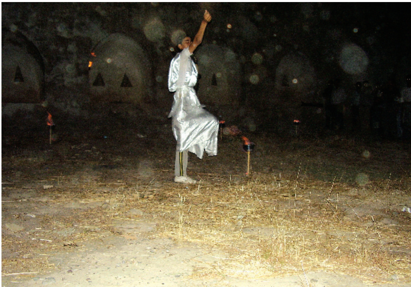
ياده وهرى دهنگ وەك ئەزمونىكى جياواز له قشلهى كۆيه

تىبينى: ئه م ووتاره به زمانى عه ره بى نووسراوه و له مالىه رى (الفوانيس) ي شانۆى ئوردنى بلاو كرا وه ته وه، به هۆى ئه وهى په يوه ندى هه بوو به م مه له فه وه كردمانه كوردى بلاومان كردوه