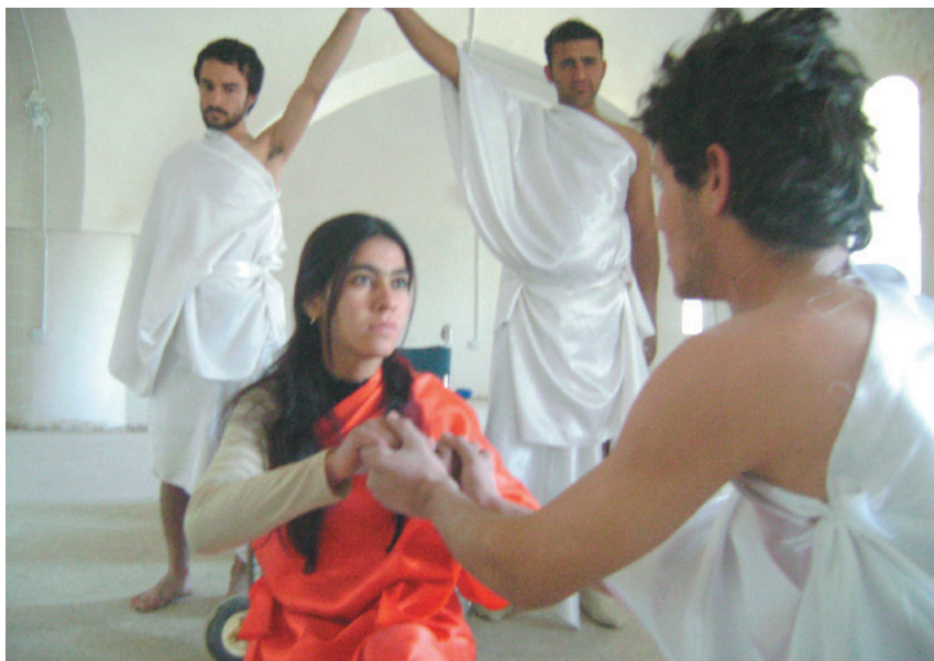
کاتی ئۆدیو پەيوەندی سینکسی لەگەڵ جۆکاستای دایکی دەبەستیت

کۆتایی شانۆ کردن دیتە بوون، ئەو گومانە لە شانۆ کردن، گومانە لەو مەعریفەیهی کە شانۆمان پێدەکات، هەموو ئەو بونیاد و پېنکھاتانەى لەرێگەى گوتارەو سێنتەر بەرھەم دێنن، گومان لەتەواویان دەکەین، ئەو گومان کردنە هەولێک نیه بۆ سەرینەو، بەلکو گەرانیکی کولتوریە لەپێناو ناسینی شانۆ لەرێگەى زانستەکانەو، ئەو هەش نمایشت کردنەوێ زانستەکان نیه، بەلکو زانستەکان مەعریفەیهکە لەرێگەى جەستەو دەبیتەو بەشیک لە جەستەى کولتوری، لەکاتی جولە کردنی جەستەى نمایش توانای بەخشینی رەھەندە مانادارەکانی هەیه. لەنیوان شانۆ و کولتور هەریەکە خاوەنی میکانیزمی تایبەت بە خۆیەتیی، شوینی نمایش کە هەمان شوینی مەشقە رۆژانەبێهەکانە، بەریەککەوتنی میکانیزمەکانی ئەو دوانەیه، بەتەنیا ئەو بەریەککەوتنە نمایش بنیات دەنیت، بنیاتنانیش بەتەنیا بەرھەم هێنانی نمایشیکی شانۆیی نیه، بەلکو لەدایکبوونی شانۆ ناسیە، چونکە نمایش لەناو دیدیکی قوولی زانست و فەلسەفە دیتە بوون، کەوابێ شانۆ ناسی ناسینی نیه پەيوەست بێت بە ووتار و توێژینەو، بەلکو ناسینی کارکردن بەرھەمی دینی، ئەو جیاوازیەکی بنەرەتی شانۆیە لەتەک هەر ژانریکی ئەدەبی. نووسین توانای ئەوێ نیه شانۆ بناسیت، ئەگەر شانۆ بۆخۆی لە تیگەیشتنی سوونەتی دەربازی نەبیت و بەرەو زمانیکی ناتەبا و جیاواز هەنگاو نەبیت، ئەوا ناتوانیت