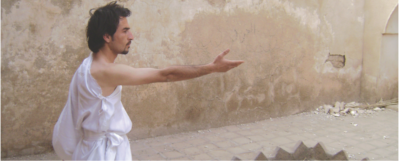
ھىكايەتى لىم ئەزمۇنىڭ لىم ئەنھالى ئەتەۋە دەپەرئىتەۋە بۇ ئەنھالى خۇد

جەستەى خۇرھەلاتى جەستەىھەكى سەركوتكراۋە، جەستەىھەكى لەجەستەى گىشتى جىا نەبۇتەۋە، بۇيە دىدى فىنۇمىنۇلۇژى بۇ ئەۋ جەستەىھە بەرەۋ تىگەىشتىنى كۆمەلناسىيانەمان دەبات، بەھۇى ئەۋەى ھەرىھەكى لە دىاردەگەرايى جەستەى ۋ دەنگى تاك ئامادە بوونىان سىراۋەتەۋە، كاتى مەشق ۋ گەرانەكان دەيانەۋى جەستەى سەركوتكراۋ بىت بە جەستەى ئامادە لە شانۇدا، ئامادەبوون نواندىك نىە بۇ نۆينەرايەتى فىگور، چۈنكە ئەكتەر بەتەنىا نۆينەرايەتى خۇى دەكات، تەنانت نۆينەرايەتى ھاورىكەشى ناكات، ھەر جەستەىھەكى پانتايەكى سەرىبەخۇى خۇى ھەيە، گەياندەۋەى ئەۋ جەستەىھە بە دەنگ پەيۋەستە بەۋ زەمەنە كۆمەلايەتىھەى جەستەى ۋ دەنگى لەيەك دابرىۋە، بەيەكگەىشتىنەۋە تواناى ئەۋەى نىە لەناۋ پىكھاتىكى كەرنەقالى كۇيان بىكاتەۋە، چۈنكە جەستەىھەكى ئازاد نىە، بۇيە لەناۋ پىكھاتى كۆلتورى كۆ دەبنەۋە، بىرۇكەى (جەستەى كەرنەقالى) چەمكىكە بە تىگەىشتىنى خۇرھەلاتىانەى ئىمە نامۇيە، بۇيە پىكھاتى كۆلتورى ئەۋ رۋوبەرەيە كە جەستەى ۋ دەنگ كۆ دەكاتەۋە، ئەۋ كۆبوونەۋەيە جەستەى ناۋ دەبات بە (جەستەى كۆلتورى) جەستەىھەكى لەنىۋ مىژۋى خۇدگەرىتى خۇى ۋ مىژۋى كۆمەلگا ۋ يادەۋەرى رۇشنىبىرى دەيەۋى بوونىكى نۆى بدۇزىتەۋە، ئەۋ بوونە لەتواناى تىكىستى نوسراۋ نىە پىى بگات، بەلكو بوونىكە لە ئەنجامى مەعرفەى نا ئامادە دەخولقىت. كۆنەكردنەۋەى جەستەى ۋ دەنگ لەناۋ پىكھاتى دەنگى، بەلكو بەيەكگەىشتىنەى لەناۋ پىكھاتى كۆلتورى، ئەۋ