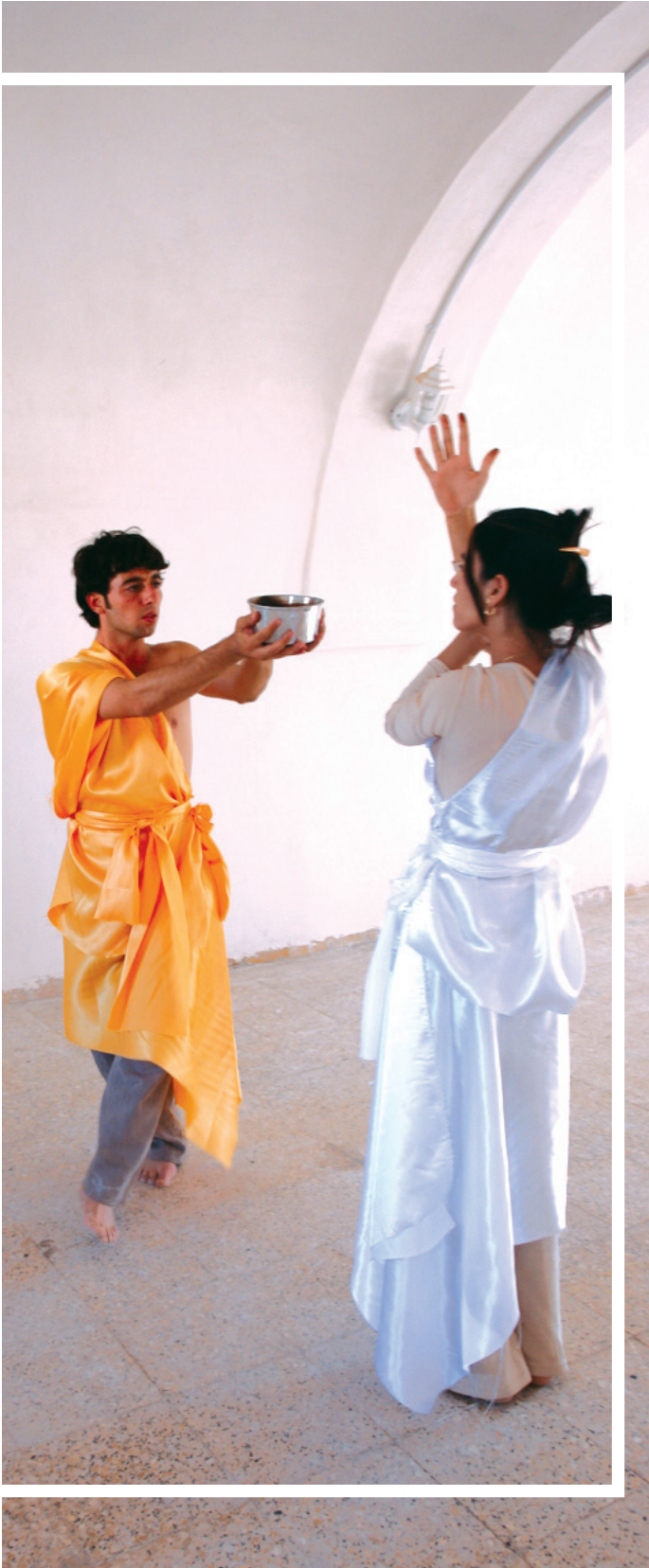
پىرۇقەيەك لە يادەۋەرى دەنگ

قىزەۋنى بوونى مرۇقى زۇر بەروونى لەلاى جامى دەردەكەۋىت، ۋەك بوونىكى سەرسۈرھىنەر بەۋىنەيەكى ووردىين و گوزارشت نامىز، ھەۋلى تيا دەدات ئەۋەمان بۇ دەربخات ئىمە بەيەكتى نامۇين، دۇراۋىن لە پەيۋەندى كرىن بەيەكەۋە، ھەندىكمان ناتوانىن لەۋەيتىر تى بگەين، ھەتاۋەكو ئەگەر