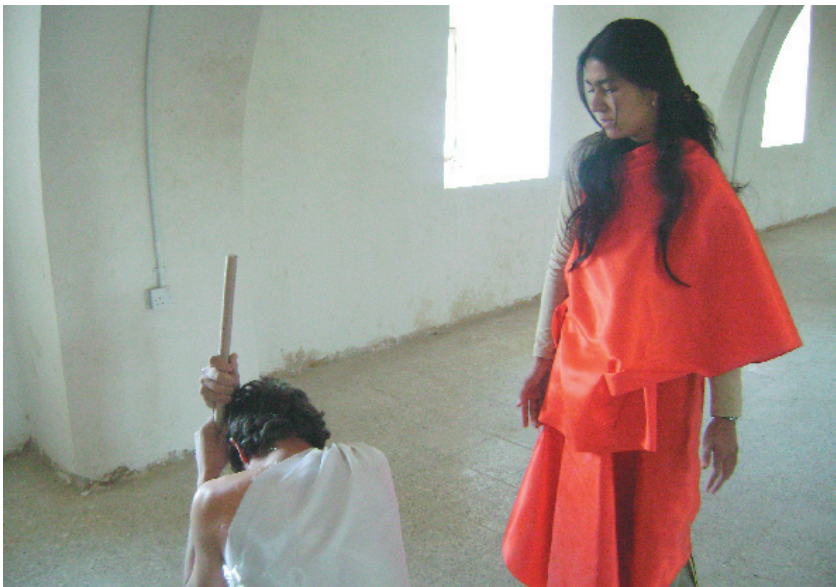
دېمەنيك لە پروفەي ئۇدىيى زەردەشت

دىدە ئەزمونىكارىمانەكان نىيە لە شانۇدا، بەلكو مەبەستمان فەرامۇش كردنى ئەو مەعريفە باوہى شانۇيە كە بەدريژايى زەمەن تىگەيشتىنى ميژويى بۇ ئەو مەعريفە ھەيە، لەناو تاكە راقەيەكى كۆنكرىتى سەيرى شانۇ دەكات، ئيمە لەكارى شانۇيدا ويستوومانە لەدەرەوہى ئەو مەعريفە سەيرى شانۇ بكەين، بەلام دەسبەردارى تىگەيشتنە زانستىەكانى شانۇي ئەزمونىگەرى نەبووينە، ھىندەي بەدژى ياسا كۆنكرىت و نەگۇرەكان وەستاوينەتەوہ، ديسان ئەو گومان كردن نىيە لەو مەعريفە شانۇيە، بەلكو گومان كردنە لەتىگەيشتىنى كوردى بۇ ئەو مەعريفە، چونكە مەعريفەكە دەتوانى بىت بە زەمىنە بۇ گۇران، بەلام بە وەستانى كارەكتەرى دۇگما بەرھەم دىت، دزايەتى كردنى ئەو دۇگمايە و ليدان لەو وينە نەگۇر و كۆنكرىتيانە ستراتىژيكي ديارى كاركدنە، كە تواناي گەران بەدواي رۇحى شانۇي ھەيە، رۇحيك ھەميشە لە گەرانى ئەزمونىكارى و پشكىنى نەزانراوہكان بىت، بۇئەوہى بەردەوام نەزانراو كەشف بكات و بەدواي نھىنيە ونبووەكانى تر بگەريت، ئەو ھەش تەنيا بەكاركردنى بەردەوام دىتەدى. خولقاندنى پەيوەندى شانۇ بە چەمك و زاراوہ سۆسيۇلۇڭزىيەكان، تيۇريزەوہيەكە شانۇ تيايدا مەبەستى كارى پشكىن كاريە بۇ خويئندەوہى رووبەريكى كەشف نەكراو، ئەو دۇزىنەوہى پرسيارە، گومانە لە تىگەيشتىنى سونەتيمان بۇ شانۇ، گۇرىنى يەكە و