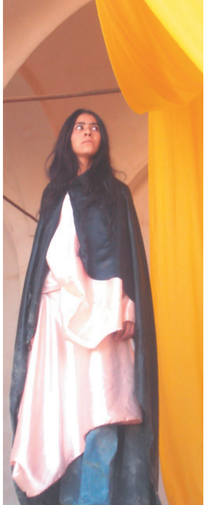
نيگاگردن وەك بەشنگ لە سمپۆلۆژياي شانۆ ناسی