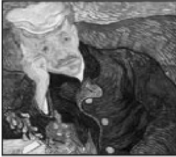
تابلوی دۆکتۆر جاشيه فانكۆخ ( ۵, ۸۲ ميليون دۆلار)