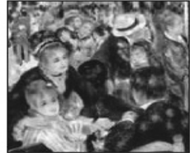
تابلوی ئاهەنگى گالييت رينوار ( ۱, ۷۸ ميليون دۆلار)