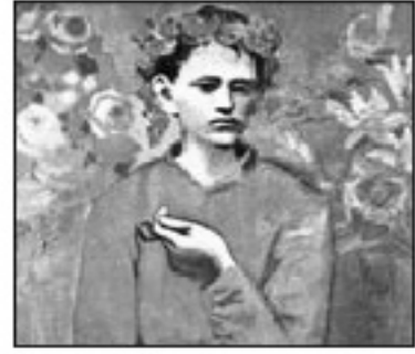
تابلوی هەرزەكار و غليۆن بيكاسۆ ( ۲, ۱۰۴ ميليون دۆلار)