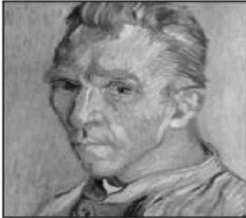
تابلوی كهسيكى بى ردين فانكۆخ ( ۵, ۷۱ ميليون دۆلار)