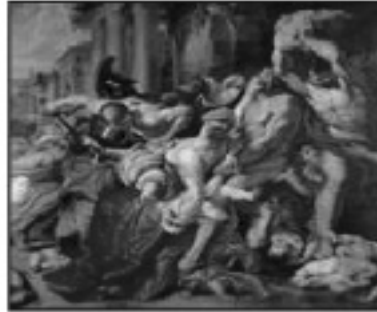
تابلوی كوشتارگه ی بيتاوانهكان رۆبينز ( ۷, ۷۶ ميليون دۆلار)