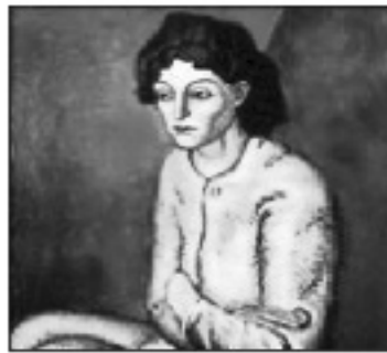
تابلوی ئافرهت بيكاسۆ ( ۵۵ ميليون دۆلار)