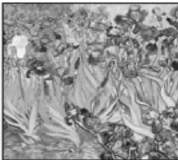
تابلوی گۆلى سهوسەن فانكۆخ ( ۹, ۵۳ ميليون دۆلار)