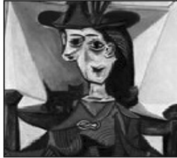
تابلوی دۆرا مار و پشيله بيكاسۆ ( ۲, ۹۵ ميليون دۆلار)