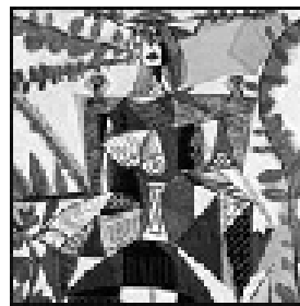
تابلوی ئافرهتییكى دانیشتوو له باخچه بيكاسۆ ( ۵, ۴۹ ميليون دۆلار)