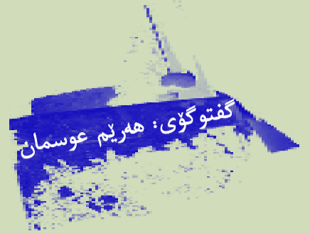
دهکات، ئەو، هه‌ولده‌دات په‌هه‌نده فەلسەفییەکانی پشتی تیڤیستیکی شاعیر و وه‌رگێڕ و پرخه‌گری ئەده‌بیی، له‌م گفتوگۆیه‌دا، شاعیر و وه‌رگێڕ و پرخه‌گری ئەده‌بیی، میتۆدییکی بووناسیانه‌وه به‌پشتبەستن به‌ تیۆره‌کانی هایدگر بخوینتەوه.