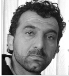
رووزار نُه حمهد