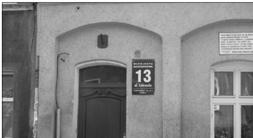
شوینی له دایکبوونی گوینتەر گراس، خانووی ژماره ۱۳ له شەقامی لیلاڤتیللا له دانتسیگ - پۆلۆنیا

راویژکاریی بە دەست هینا. گراس له نیوهی ریگا له شرۆدەر سارد بووهوه و کهوتە پەخنە لێ گرتنی، بەلام له رووی دژایهتی کردنی ئۆپەراسیۆنی رزگار کردنی عیراقهوه نا، چونکه شرۆدەر تا کۆتایی ماوهی دەسه لاتی خووی له م رووهوه سستی نه نواند، بەلکو گراس شرۆدەری به پاشگەز بوونهوه لهو بەلێنانه تۆمەتبار کرد که به گەلی ئەلمانی دابوو.