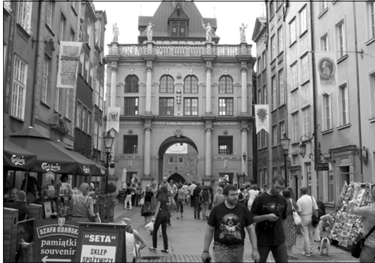
دیمه‌نیک له ناوهندی شاری دانسیگ