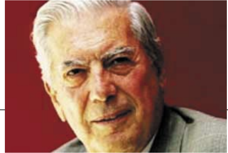
و: سۆران خدری پوور

(ماریو بارگاس یوسا) له کاتیڤدا که چاکهتییکی وهرزشی و کراسییکی سووری له بهردایه، دهلیت: (ئهدهبیات کارو کاسبی منه! هیچ کات ناماده نیم دهست لهم جیهانه پر لهفته ننازییه هه لگرم و خانه نشین بم. منیش پیمخۆشه برۆمه سهر شه قام. (بارگاس یوسا یه کینکه له نووسهره دیاره کانی ئه ده بی ئه مریکای باشوور. ژبانی پیشه بی خۆی له ته مه نی ۱۵ سالیه وه ده ستیپ کردوه، واته ئه و کاته ی له شاری لیما، هه والنیری به شی تاوانه کانی روژنامه ی (لاکرونیکا) بوو. یوسا ئه م روژانه ش هه ر روژنامه نووسه و ستونییکی له روژنامه ی ئیسپانیایی (ئال پائیس) هه یه که ئه م ستونه ئه و ی سهرقال کردوه ده رباره ی بابه تی جیاواز، له وانه شه ری عیراق و پرسه هیرشی روسیا بۆ خاکی جوارجیا ده نووسیته. هه رچه ن یوسا هه رده م جیاوازی داده نیته له نیوان روژنامه نووسی و ئه ده بدا، به لام جیهانی ده ره وه ی ماله وه ی (کاره سیاسییه کانی) کاریگه ری زۆری هه بووه له سهر جیهانی نووسینی ئه و. یوسا ده لیته: "که ده نووسم به تازادیی ته واه وه ده نووسم، به لام پیویستم