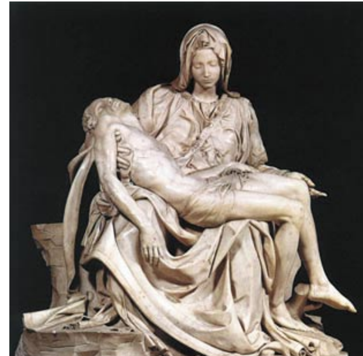
◆ نوخشه عهبدول

گۆرانکارییه کی گشتگیر له قوناعی رینسانسدا تهواوی ئهرووپای گرتهوه، ئهمهش دهرتهجمامی ههوله فیکری و عهقلانییه کانی سهدهی (۱۵و۱۴) بوو، که له سهدهی (۱۶) دا گه یشتنه لوتکه. ئهو قوناعه هیچ بهرهممکی مرۆیی نه بوو له یادی بکات، گۆرانکارییه جهوه هیری سهرحهم پیکهاته کانی گرتبووه. هونهریش یه کێک بوو لهو پیکهاته نهی گۆرانی ریشهیی به سهرداهات، رینسانس ناوهزۆکیکی تری به خشییه هونهر.