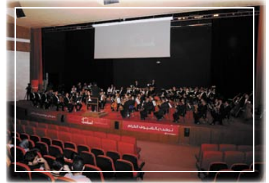
ئۆركىستراى سىمفونى نىشتمانى عىراق