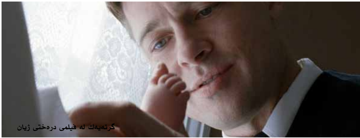
گرتھېك له فيلمی درهختی ژيان

پېښه خشیوه، به جۆرېک زۆر بهی هاوکاره کانی ناره زوی نزیکه وتنه وه له م درهینه ره ده کەن . لسلی وۆد هۆد، دۆکیۆمینتاریستی به ریتانی ده لیت: «من و ترینس مالیک زیاتر له سالیک پیکه وه کارمان کردوه، ماوه یه کی زۆر بیرم له وه ده کرده وه، که من ته نها که سیکم له ئەمریکا که ژماره ته له فۆنه کهی ئەوم لایه ...» . مالیک دواى فيلمی براوهی ئۆسکار (رۆژانی به هه شت) له سالی ۱۹۷۸ بۆ ماوهی ۲۰ سال دیارنه ماو دواتر به فيلمی (هیللی سووری باریک ۱۹۹۸) گه راپه وه . ته نانه ت هۆکاری دیارنه مانی مالیک له ماوهی ئەو بیست ساله دا وه ک نهینییه ک ماوه ته وه و ئەمه ش بوته هۆی ئەوهی نازناوی (جی دی سالینجه) ی سینه مای پېښه خشن .