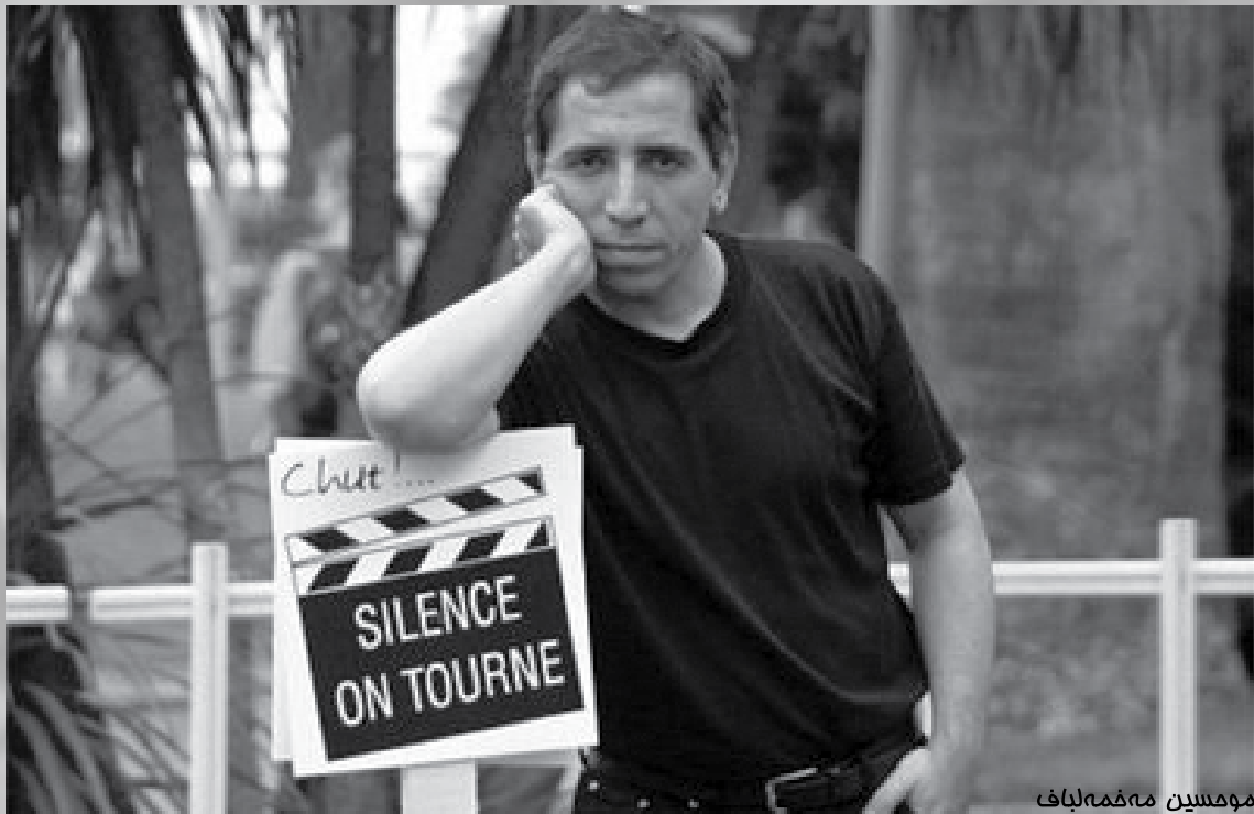
مومسین مهفمه لبا ف

جیا له و فیستیقاله سینهماییانهی سالانه له جیهاندا