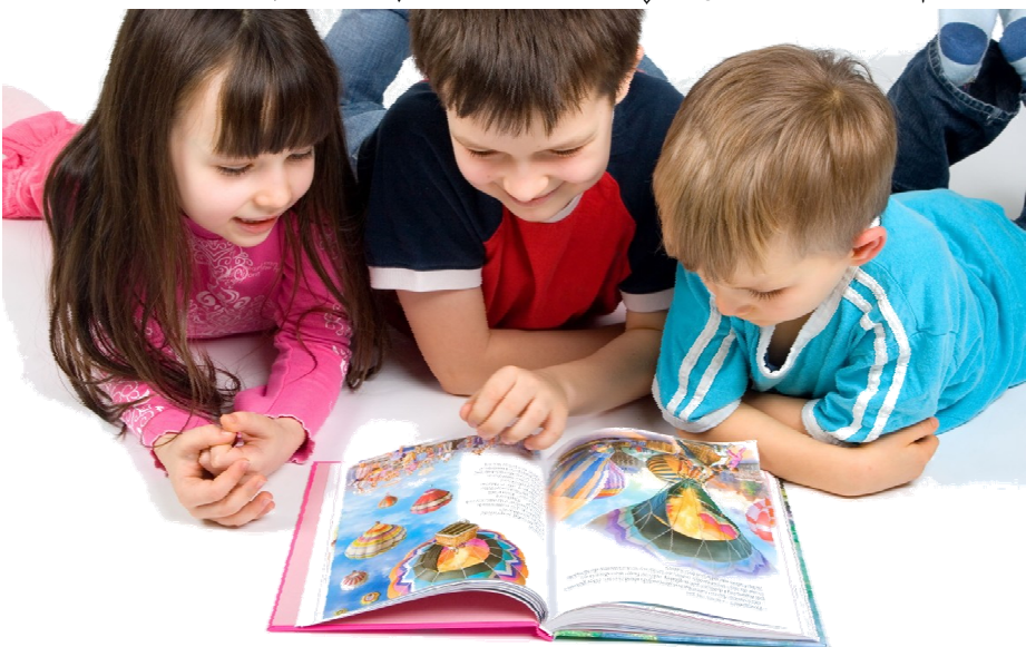
خویندنه‌وهى ئازاد... یان ئەندێشە و شادی بۆ مندالان