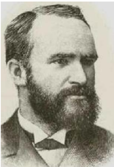
(سفر) زانىارىي گىشتى

زانارىيەكان، بەپىي ئەم سىستەمە بەسەر ئەم بەشە سەرەككىيانەدا دابەشكارون: