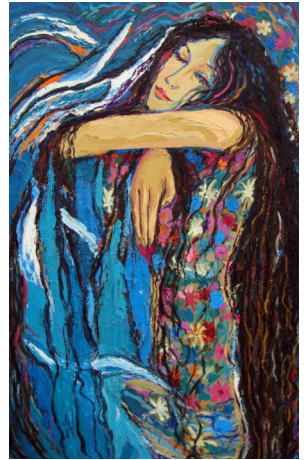
تابلۆیهکی هونهرمه نند یان عوسمان

شایانی وتنه، ئه م ربه ره به سه رکردنه وه یه کی گرنگه بۆ ژنه هونه رمه ندهکانی کورد، ئه وانیه ههر له شه سه تهکانی سه ده ی رابردوه وه تا ئه مپۆ خزمه تی بهرچاویان به بزاقی هونه ری شیوه کاری کوردی گه یاندوه.