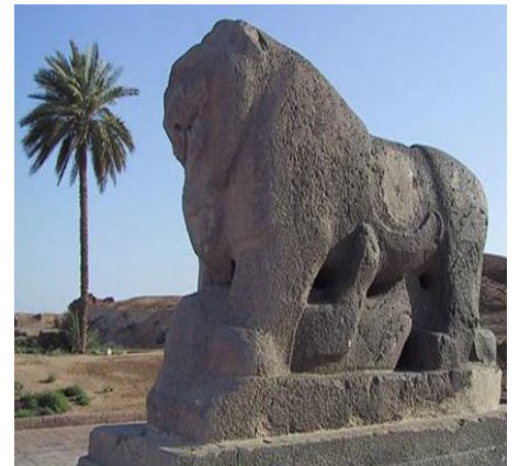
شيره كهى بابل

(خه تى بزمارى) يه و گرنگى و متمانهى سوّمهريه كان به هوى داهينانى شه خه تى خزمه تى گه وهى شه وانه وه به مرقابيه تى. قه له ميكي كانزابى و تيزيان بۆ نووسين به كارده هيناه وه سه ر چه ند ماده يه كى وه كو قورپ