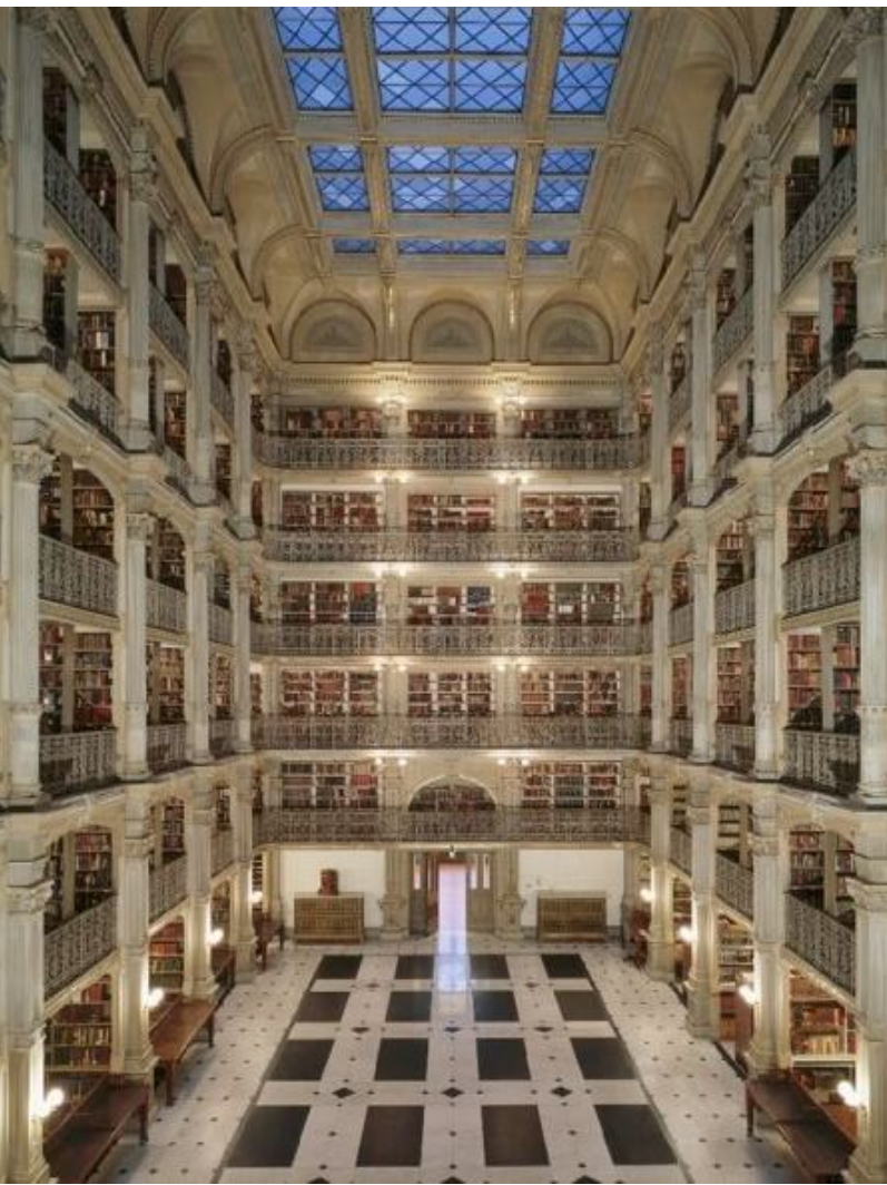
کتبخانه ی کشتیی مارلاند له ئهریکای

د‌ه‌ره‌خ‌س‌ت‌ئ‌ی با‌یه‌خی زیاتر ب‌ده‌ن ب‌پ‌ش‌که‌ش‌کردنی باش‌ترین خ‌ز‌مه‌ت‌گ‌و‌زاری و‌به‌ن‌خ‌ر‌تی‌وو‌ن کار‌ی‌گه‌ر‌ترینان به‌سوو‌ده‌من‌د، به‌ واتا‌یه‌کی ت‌ر زانستی به‌بازاریکردن هه‌ر فله‌سه‌فه‌و م‌ی‌ژ‌دی‌کی پ‌راک‌تیکی سه‌ر‌ه‌کو‌ت‌وو‌ه بۆ پ‌ش‌که‌ش‌کردنی خ‌ز‌مه‌ت‌گ‌و‌زاری کار‌ی‌گه‌ر. ئ‌ه‌وه‌رێکت، هه‌رحۆن له‌سه‌نگاندنی راسته‌قینه‌ی هه‌ر کښتبخانه‌یه‌کیش به‌یوه‌سته به‌چ‌ۆ‌ن‌ت‌ئ‌ی به‌کاره‌م‌تانی‌و سوو‌ ل‌ی‌وه‌ر‌گ‌رت‌نی له‌ل‌ا‌پ‌ه‌ن خ‌و‌ت‌ن‌ه‌وان‌ه‌و. ئ‌ه‌وه‌ ک‌وات‌ه‌ پ‌ی‌و‌ی‌سته له‌سه‌ر کښتبخانه‌کان له‌رێژی گرته‌به‌ری باش‌ترین ر‌ی‌گ‌ا‌وه‌ له‌خ‌س‌ل‌ه‌تی ک‌و‌ا‌ه‌ سوو‌ده‌من‌دانی ت‌پ‌یک‌ا‌ن، له‌وان‌ه‌ش ر‌ی‌گ‌ا‌کانی به‌کاره‌م‌تانی بازاریکردنی ئ‌ه‌و که ت‌پ‌ا‌ی‌دا هه‌ر‌ه‌مه‌ین، یان سوو‌ده‌من‌د ده‌ب‌یت‌ه‌ ئ‌ه‌وه‌ی چ‌ا‌ل‌ا‌ک‌ی‌ه‌ه‌ که به‌بازاریکردن ر‌ازی بوونی، ئ‌ه‌و سه‌ر‌ه‌ه‌ت‌و‌و‌ی ئ‌ه‌و دامه‌زراره نیشاندانه‌ته‌ له‌ه‌ن‌انه‌یه‌ی پ‌س‌لا‌و ئامان‌ج‌ه‌کانی و‌به‌رده‌وامی‌ له‌ گه‌شو و‌ پ‌ش‌که‌وت‌ندا.