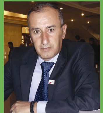
عبد الرحمن باهەرنی

دقیت ئەم بیرکرنەقەیی دەندەک خالیان دی یێن گرنگ دا بکەین کو رەنگە دقان هەفکێشەییان دا ئەم جارین بهیت و یێن بهیت ژێ بکەقینە کێشەییان کویتر و مەزنتەر، ئەو ژێ ئەم دوو تشتان ژ ئیک جودابکەین، سیاسەتا مە ل هەریمی ب ئوپوزسیون و دەستەهلات قە و بەهەمی ناکوکیان خوە قە بدانینە ئالیەکی و ل بەغدا مە بیرکرنەقەییەکا دی و جوداتر هەبیت و ئەم هەفکێشەییان و ناکوکیان خوە ل بەرامبەری دەستکەفتین نەتەوهی ب دانینە ئالیەکی، هەر چەندە لیستا (برایەتی و پێگە ژیان)، کو دی بەشداری هەلبژارتین جقاتین پارێزگەهین عراقی بیت هەمی ئالیان سیاسی یێن کوردستانی ب دەسەهلات و ئوپوزسیون قە تیدا نە و ئەقە ژێ ئامازەییەکا باشە بو پارێزگاریکرنی ل دەستکەفتین مە ل بەغدا و ئەق پێنگا قە یا دەیتە هاقیت و ئەقە ژێ پێگەیی کوردان ل بەغدا قایم و بهیز دکەت، لی ئەقە بتنی بەس نینە، دقیت سیاسی مە، پەرلەمانتارین مە و وەزیرین مە ل بەغدا نە بتنی یاریکەرین سیاسی بن ل هیلا بەرگریکرنی، بەلکو یاریکەرین سیاسی بن لەهیلا هیرش برنی و ئەقە ژێ نابیت ئەگەر لپێچینەوه دگەل وان پەرلەمانتار و وەزیران و ئەدانا وان نەهیتە کرن و هەلسەنگاندن بو نەبیت و ئەقە ددەمەکی دا، تا نوکە ژێ مە گوھ لپێهەبویە، ئیک وەزیر یان پەرلەمانتار ژبەر کەمتەرخەمی و لاوازی ئەدانی وی هاتیبەتە گوهرین یان گازیکرن.