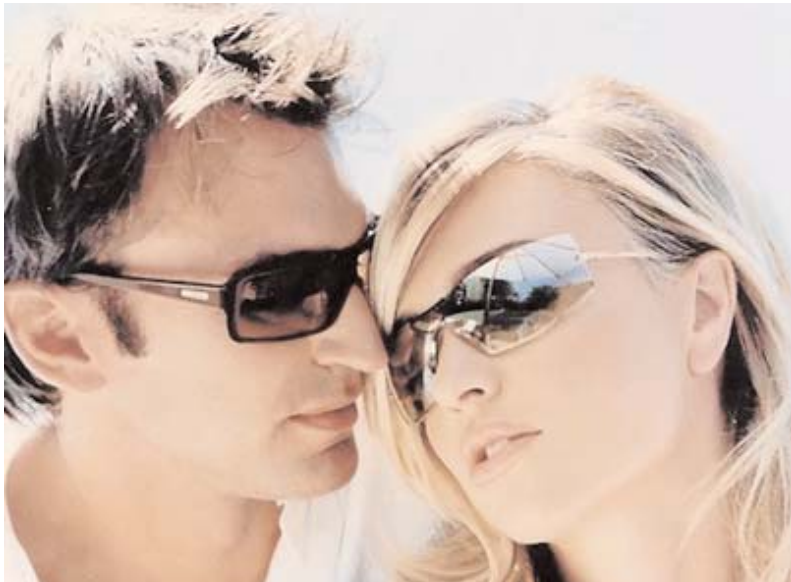
ژيانا ھاوسەرگىرىن دوماھى ھزرا کچان بو بەرەف ژيانەکا ئارام

کچەکا نەمەن ۲۱ سالی و خویندکارا شەشى نامادەى یە گوتی: گەلەک کچک ۳۰۰ تا ۴۰۰ گرامىن زیرى دخازن و تانىف کیلویا زیرى ژى بىن ھاتىنە خاستن. سەبارەت ئەگەر رزق وى ھات و کەسەکی ئەو خاست وى ل بەرە چەندى بخازىت، بفي رهنكى گوت: من د سەرى خوە دا ھزر کرىە تا ۴۰۰ گرامىن زیرى بخو بخازم و ئەگەر من دیت حالى کورکی نە گەلەک بى باشە دىبىت کىمترى بخازم، ئەفە ژى زیدەتر دمىنىت ل سەر کور و کچان و ریکەفتنى و ئەگەر ھەژىکرن دناقبەرا وان دا ھەبىت، رەنگە زیدەتر ھاریکار بن دگەل ئىک دا.