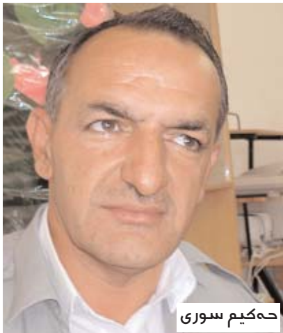
حه کیم سوری

خوه ته مام بکهت و ئه گهر ته مام کر ئه قه دهرفه تا وئ یا شویکرنی کیم بو و ئه گهر ته مام ژی نه کر و پروسا هاوسه رگریی