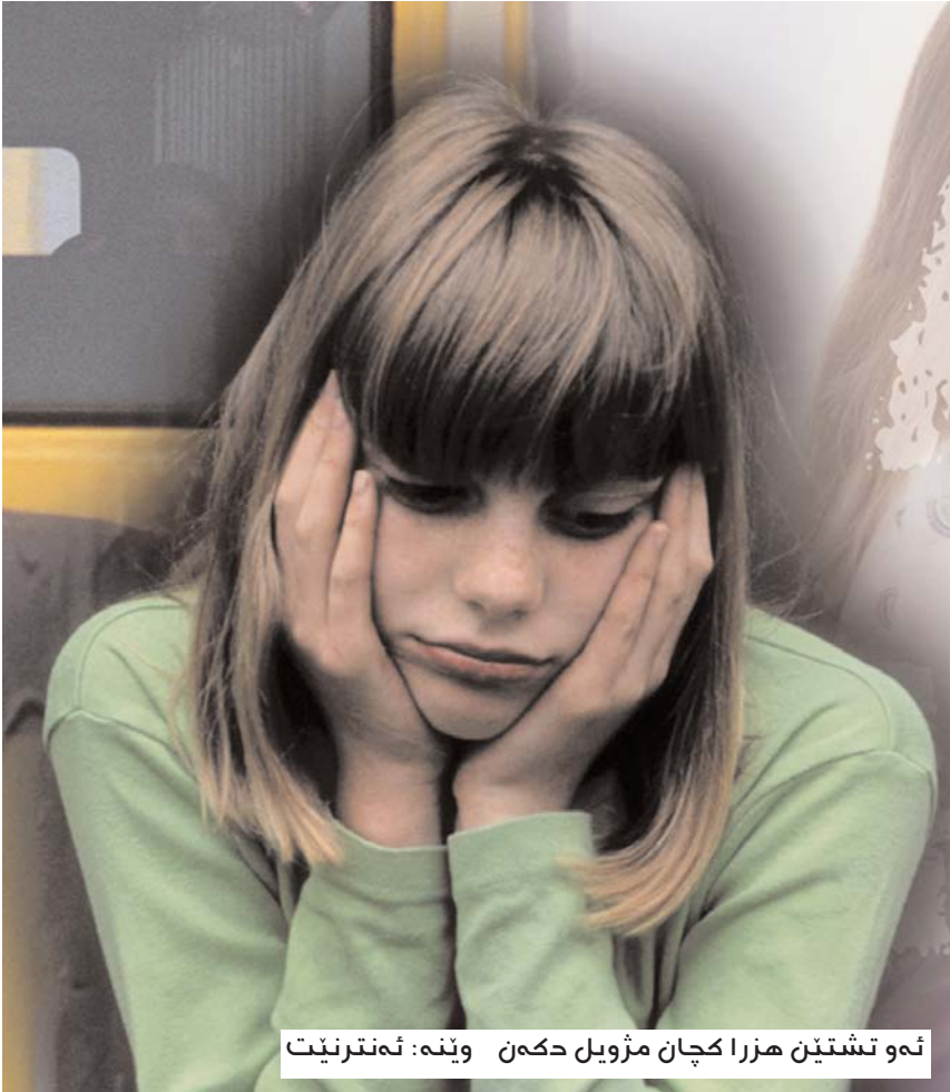
ئەو تىشتىن ھزرا كچان مژوبىل دكەن وئىنە: ئەنترنىت