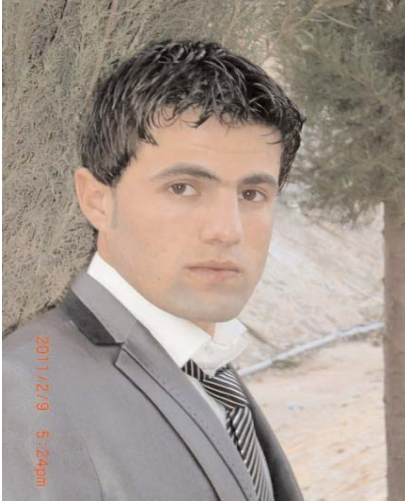
سوهه يب شيخ بزيني