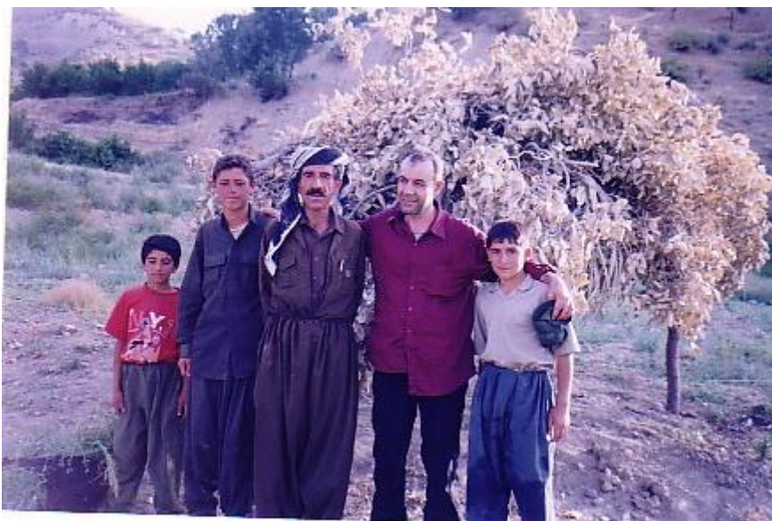
هه ندرین له گه ل خیزانیکی گوندی هه ناره، هاوینی 2005

ئه وه تا من دوا ی 20 سال، که له روانین بترازی هیچیترم نییه تا کوو برینه کانی خو م و ئه و خیزانه ی گوندی هه ناره بلاوینمه وه. بو یه بیزاریبیه کانی ئه و خیزانه له ره فتاری مردوخی حیزبی شیوعیی و بالادهستی هه مان ئه و جاشانه ی، که به شدار بوون له ویرانکردنی گونده که یان، روخی منیان ناموتر ده کرد. بو ئه وه ی که میک سنبووری به وان و خو م ببه خشم، ته نیا توانیم داوایان لیکه م، که وینه یه کم له گه ل بگرن. پیاوه که و دوو منداله هه راشه که ی، وهک هاوخه میک وینه که مان گرت، به لام شهرم ریگه ی له ژنه که گرت، که له و وینه گرنته دا یاده کانمان کو بکه ینه وه.