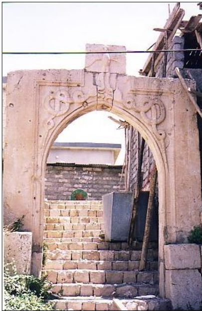
ئامیدی، دەرگای کۆنی بەھدینان بە کامیرای ھەندریین حوزەیرانی 2005

پاکی ئەو خەمە پەروردهییە خۆیەو، وەک وینە مامۆستایەکی کارامە، ئەگەر وەک ئەو بۆینباخیک لە چەشنی پەرورده ئامیزی خۆی لە ملم بکەم، ئەو قەولی پیدام، گەر بگەریمەو و لەوئ بجمە مامۆستایەکی هاوکاری بۆ پرۆژە پەروردهی ئەو نەو داھاتووێ کورد، ژنیکیشم بۆ بینیت!