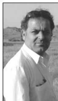
نا: ناشتی گەرمیانی