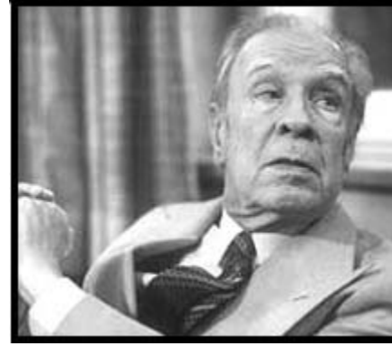
خۇرخى لۇيس بۇرخيس