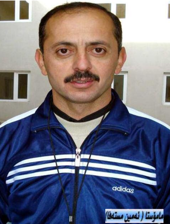
مامۇستا (ئەمىن مستەھا)

نۆينەرايەتى بېتوئىنى لىژنەنى ئۆلۈمبىي و ھەموو ئەو كەسانە بىكەم كە ھاوكارىيان كىردووين ❖ لە كۆتايىشدا مامۇستا وشيار فەتاح سەبارەت بە بەشدارىكىردىنيان لە خولەكاندا پىي گوتىن ❖ تا ئىستا بەشدارى يەك چالاكىمان كىردووه كە سالى رابىردوو لە ھەولپىر بەشدارى خولى پەيمانگا وەرزىشەكانمان كىردو توانىمان لە يارى تۆپى سەرمىزدا پەلى دووم دەستەبەر بىكەين و ئىستاش لە خۇئامادەكىردىنداين بۇ بەشدارىكىردن لە خولەكاندا ❖ دواتر مامۇستا (ھاوكار جەلال) پىش كە يارىدەدەرى بەرىئودرى پەيمانگاى وەرزىش رانىيە قەسى