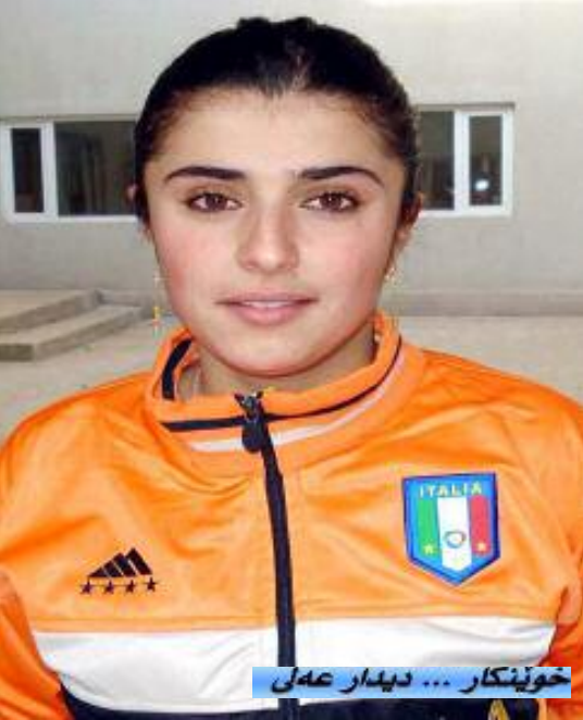
خویندگار ... دیدار عهلی