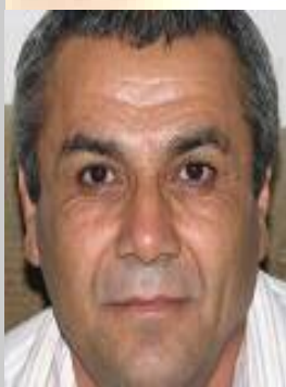
رىياز مۇخمەدەد ئىيۈە

ھەممومان رەخنە دەگرىن، رەنگە زۆرکات رەخنەكانىشمان تىرىكى دوورھاۋىژو دەم ھەراش بېت و زىان بەخۇمان و بەزەكانىش بگەيىتتە و لەناكامدا بەتابورو تاپرى چەند ساچمە ناومان بەرن و بەھۆى بى ئاگايى و بىرەسكى راپۇرت نووسىكەو ھەسرى ماش و برنجىمان بخوات. ھەممومان گلەيى دەكەين رەنگە گلەيەكانىشمان بەپىي پىۋىسىت لەشۋىنى خۇيدا بېت، بەلام كى دەبېتە فرىادرسىنك و گلەيەكان ۋەك كۆترىكى نامەبەر دەگەيىتتە شۋىنى مەبەست.