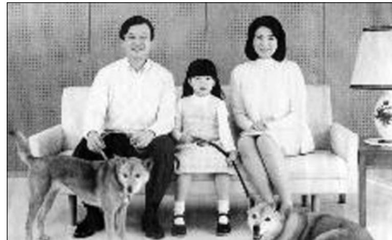
پرينس و پرينسيس و كيژهكهيان