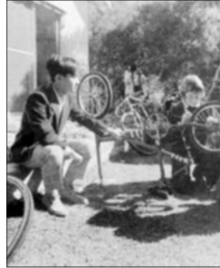
ناروهيئو به منالي