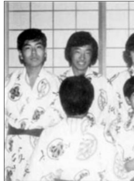
ناروهيئو له ئوسترااليا