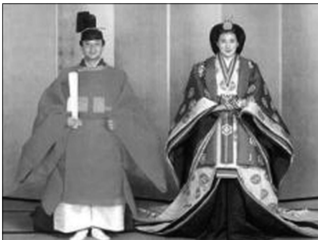
بووك و زاوا به جلى تهقليدى ئيمپراتوريهت