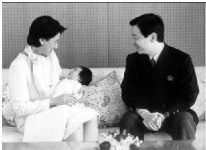
نو سال پاش زه واجيان