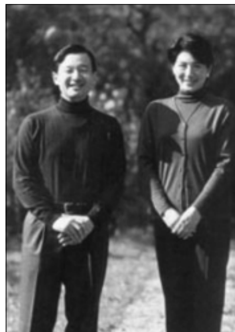
به جلي ره سميه وه به لام به روويكي ناخوش