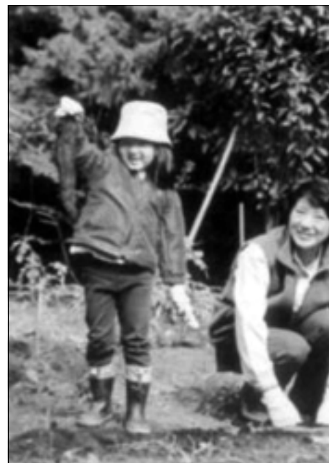
پرينسيس لهگه ل كيژه كه ي له ناو باخچه ي كوشكدا