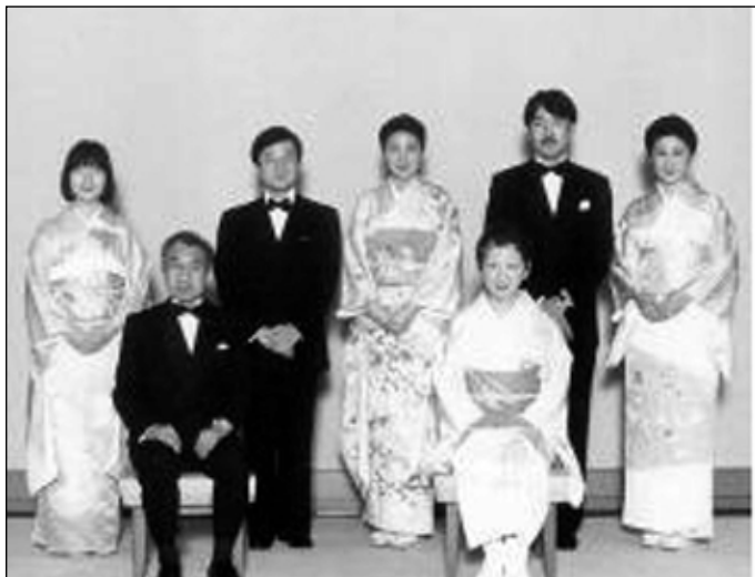
لهگه ل بنه ماله ئيمپراتور