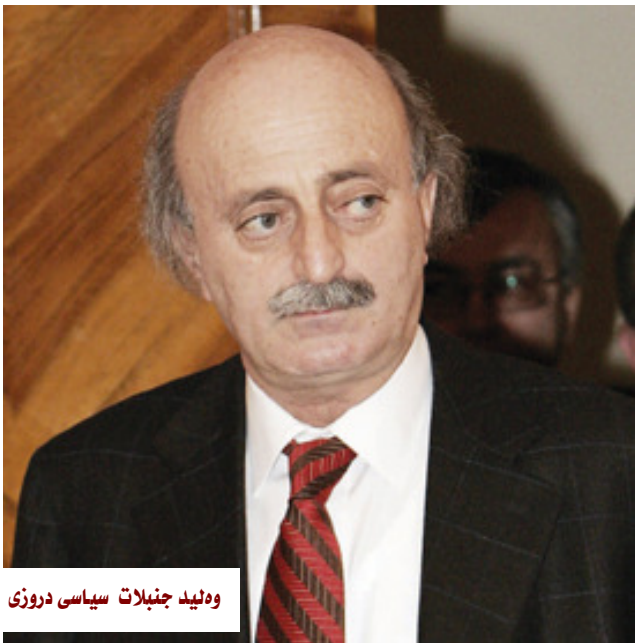
وھلید جنبلات سیاسی دروزی