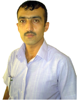
كاكه مين كه مال

۱۰۲۱ ز كوژرا، كه به كه سيكي توندو تيزو توقيته ناسرابوو. ونبووني له بارودوخچي ئالوزو ته مومزاويدا بوو، بويه مقومقويه كي زوري نايه وه، لايه نگراني واياي راگه ياند كه (مه نسور) له كاتي خويدا دهگه پريته وه.