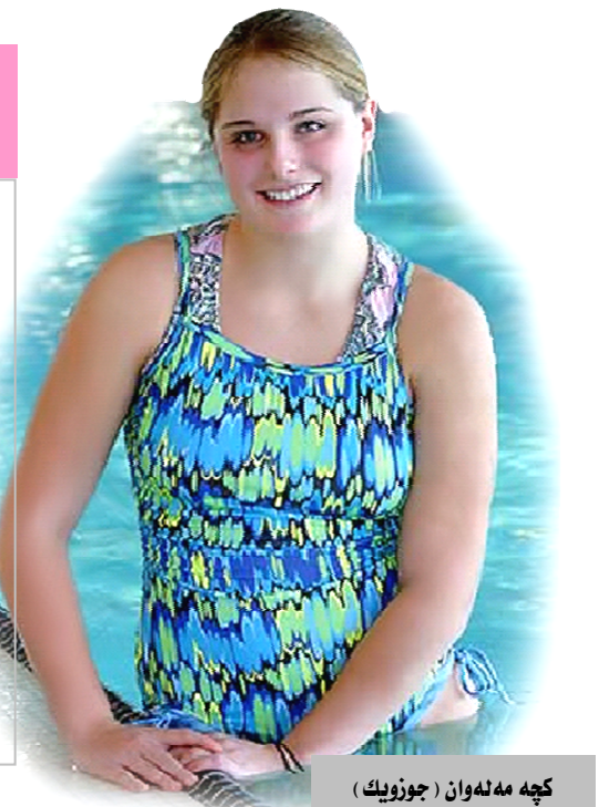
کچە مەلەوان (جوزویک)

مەلەوانی جۆلەییەکی هونەری بوونەوێرەکانە لەناو ئاودا، هەروەها چالاکییەکی بۆ مەبەستی خۆشی و رابواردن ئەنجامدەدرێت، لە هەمانکاتدا وەرزشییەکی برەوی هەیە و سوودیکی جەستەیی و دەروونی باشی هەیە. مێژووی ئەم وەرزشە بۆ سەردەمانێکی زوو دەگەڕێتەوە، وێنەکانی مەلەوانی لە ئەشکەوتەکانی میسری کۆنی سەردەمی چاخی بەردینەکان دۆزراونەتەوێ. لە ساڵی (٢٠٠٠) پ.ز لە داستانی گلگامیش و ئەلیادە و ئۆدیسای کتیبی پەرۆز باسی لێوەکراوە. مەلەوانی وەک وەرزش لە ئەوروپا لە ساڵی (١٨٠٠) ئەنجامدرا، تەنها شێوازیکی مەلەوانی کە پەپەرەوکر مەلەوانی سەر سنگ بوو، لەیەکەم خولی یاریەکانی ئۆلۆمپیاد لە ئەسینا ساڵی (١٨٩٦) بەکێک بوو لە یاریەکان، لە ساڵی (١٩٠٨) یەکیکی مەلەوانی جیهانی (FINA) دامەزرا. گرنجترین خۆرەکانی ئەم یاریە: مەلەوانی سەر پشت، پەپولە، مەلەوانی ئازادە، پێشپێرکیەکانی بە شێوێ تاک و بە شێوێ تیم ئەنجامدەدرێت. گۆمی مەلەوانی نیووەلەتی درێژییەکی (٥٠)م و پانیەکی (٢١)م و قولاییەکی (١,٨٠)م بەرزی رەمبەیی خۆفێدان نیو مەترە، یان سی چارکی مەتریکە.