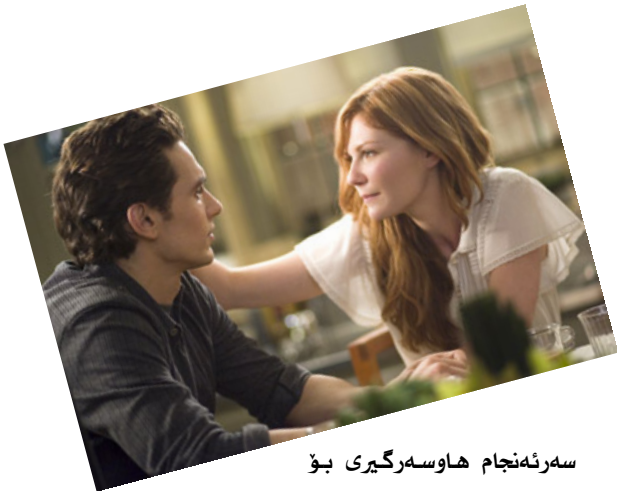
سەرئەنجام ھاوسەرگىرى بۇ

تەندىروستى جەستە و دەروونمان باشە يان خراپە؟!