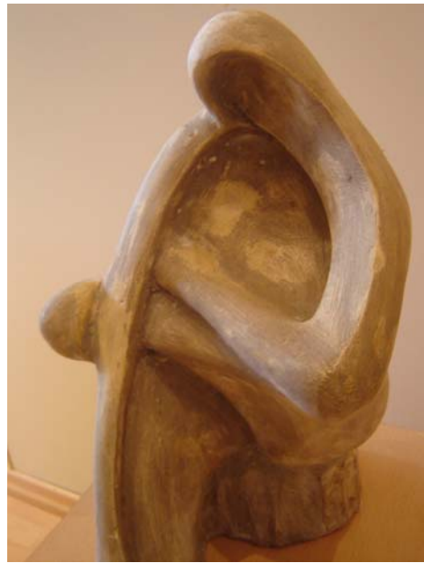
کار يکی به يان مانى

به ره مه مەکانى نه م هونه رمه ندى هه مه لايه ن و هه مه ستايل بوو ، به پروای من نه مه ديار ترين خالى سه رنجى پيشانگه که بوو ، جگه له وه ی زور يک له به ره مه مەکان ئيشکردن بوو له نيو که ره سه ته کانی سر و شتدا ، به تا يبه تى دار ، دياره دار به هه موو پيکها ته و ميژووى خو يه وه لای