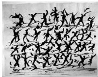
Encre de Chine sur papier d'Indochine, vers 1958, 37,5 x 47,5 cm

پاشان ئهوه ژيانه تیکقژان و ئاپۆرهی خهلك له كاره هونهرییهكانی میشۆ، له پیتشهوهشیان هیلکاریهكانی " " كه ئهوه له 1950 هوه دروستیکردن، رهنگیادیهوه. Les encres de Chine مهکهرهبی چینی: