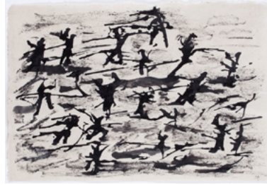
Sans titre, technique mixte sur papier, 31 x 24 cm