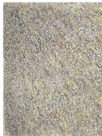
Post-meskalin, 1969 Krita på papper 32x23 cm