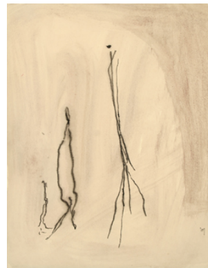
Sans titre, technique mixte sur papier, 33 x 25 cm