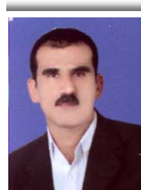
ياساناس / بەھادین ئەحمەد

حزب یان با بلین پارت ، کۆمەلئ خەلکە لە ریکخستنیکدا ئایدۆلۆژیایەکیان پرۆگرامیک کۆیان دەکاتەوہ ، بە ئامانجی گەیشتن بە دەسەلات یان پارستنی ئەگەر پارت لە دەسەلاتدا بوو ، ئەمە وەکو پیناسە ی زانستیانە ی پارٹی رامیاری (حزب سیاسی) .