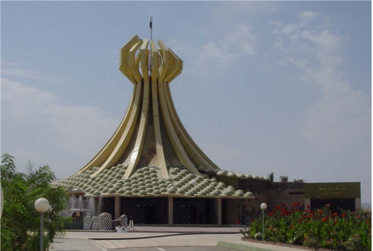
مینۆمینت.. سیمبولی شهیدانی هه‌له‌بجه بهر له سووتان..

کاره‌ساتیکی خودایه و ده‌کری خه‌لکی هه‌له‌بجه خه‌لکی ناموسولمان بووین و بهر تووره بوون و به‌خه‌به‌ر هینانه‌وه‌ی خودای خویان که‌وتبن، بویه پیویسته بگه‌رینه‌وه بۆ لای خودا و نزاو نازاره‌کانیشیان ناراسته‌ی نه‌و بکن، بۆ نه‌وه‌ی تۆله‌یان بسینیت، وه‌ک چۆن خویان تۆله‌ی سه‌رپیچی خویان دا. نه‌و بۆچوونه دیماکۆگه‌یه‌یان هه‌ر له‌و ناکاره‌دا نه‌ه‌یشته‌وه و گه‌یانیدیان به‌ پرۆژه بازگانیه‌کانی ئیسلامگه‌ره له‌ خویان توند‌ه‌وت‌ره‌کان و نه‌و ناوچه‌یه‌ کرا به‌ به‌شیک له‌ دۆزه‌خی مرۆقه‌ نیرۆدی (عسابی)یه‌کان، نه‌وانه‌ی له‌ بری بالاکردنی هه‌له‌بجه بۆ دۆخی ناشتی په‌رستی مرۆقدۆستی یه‌که‌م، مل له‌ لاشه‌ کردنه‌وه‌ی ناشکرا له‌ ناو کوردستاندا به‌ ده‌ستی نه‌و گروپه‌ نیرۆدی له‌ هه‌له‌بجه‌دا نه‌نجامدرا و هه‌له‌بجه‌ کرا به‌ مۆلگه‌ی سه‌ربرین و شه‌هیدکردنه‌وه‌ی دووباره‌ی هه‌له‌بجه به‌ راده‌یه‌ک له‌ شه‌هید بوونی یه‌که‌می زیاتر راگه‌یاننده‌کانی جیهان باسی ده‌ستی تیرۆستی کرد له‌و ناوچه‌یه‌ و ده‌وروویه‌ریدا. له‌ رووی مرۆیی و شارستانیشه‌وه، هه‌له‌بجه‌ گه‌رینه‌دراوه‌ بۆ سه‌ده‌کانی ناوه‌راست، نه‌وه‌ لاوانی هه‌له‌بجه بوون به‌ ده‌ستی هه‌لگرانی نه‌و نایدۆلۆژییه‌ دیماکۆگه‌ یاساگی کاره‌با و ژیا‌نی مۆدرین و ته‌نانه‌ت هه‌لبژاردنی بیروباوه‌ریشیان لی‌ گه‌رابوو، له‌ سه‌رشه‌قامه‌کان پشته‌ ملیان ده‌گیرا و به‌ زۆر ده‌نا‌خه‌ترانه‌ نیو مرگه‌وته‌کان و به‌ زۆر نویژیان پی‌ ده‌کرا، نه‌وه‌ ژنانی هه‌له‌بجه بوون له‌ هه‌موو سیمایه‌کی مرۆیی بی‌ به‌شکرا‌بوون و ته‌نانه‌ت پارچه‌ پۆشاک‌یکی خویان له‌ بازاره‌کاندا به‌رچاو نه‌ده‌که‌وت بیکرن و تاقی کردنه‌وه‌ی پۆشاک بۆیان یاساغ بوو... هتد. هه‌میشه‌ کۆمه‌لی پاش