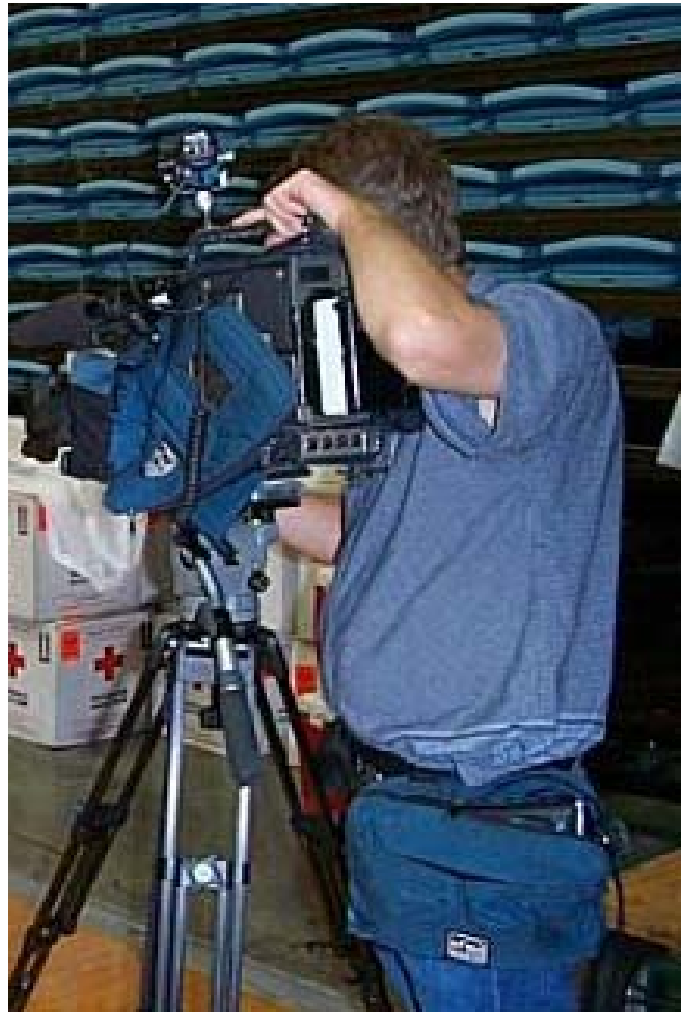
راگه ياندنى لوكال، گواستنهوهو ناساندنى شوناسى ناوچه بهك...

پوژنامەى پوژئانه و ههفته نامەى كارلستادس تيدنينگنه. ئەگەر باس لە راديۆى لوكال بكهين دەبيين لە سوید نزيكەى 114 ئيزگەى لوكال بە ناوى "راديۆى سوید" ههيه و لە هه مان كات نزيكەى 85 ئيزگەى سەر بە كهرتى تايبه تيش ههيه. ئەم ئيزگانە بايه خى خويان ههيه و دياره بهى شك گوئگرى خويان ههيه. ئەگەر ئيزگه كانى سەر بە كهرتى تايبهت، خويان، خويان بدات، به لام ئيزگه كانى سەر بە كهرتى تايبهت، خويان، خويان دەژيبن و به موى ريكلامه وه پاره بوخويان پهيدا دهكهن. راگه ياندنى لوكال له دهوله تانى پيشكه وتوو، نهوه ناگهيه نييت، كه بهرهمه كانيان، به ناوه روک خراپ و به رووكهش جوان نيين، به لكو نهوان توانيويانه له گه ل پوژنامه گه وره كانيش بهر بهر بهر كانى له سەر بازار بكهن. ژيان و مانه وه شيان تا ئيستا، نيشانى ده دات، هاوته ريب و يه كسان ده پوون.