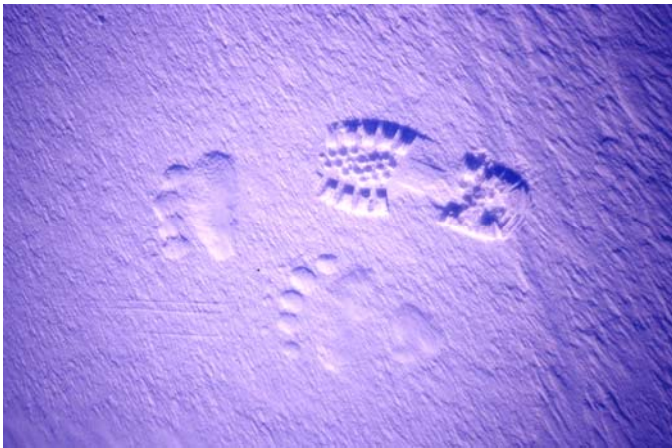
نه شوین پیښه کی هه رگیز ون نابن