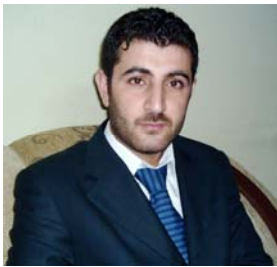
رئیسە ئاھەندە سەعدو ئالا ئەحمەد