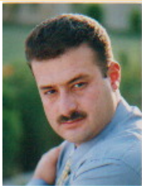
كه يفي شه مزيني

چ جاي نه وهی ئەمەشی بپته پری و کچه که له ریگه یه کی ناشه رعیه وه موماره سه ی سیکیسی ئەنجام بدات؟ ئەهی باشه نه ده کرا ئەو هاو پیه ی پیده چیپت دهسته خوشکیکی نزیك و راسته قینه ی ئەو بووه ( ئەویش ههروهک له نامه کهدا باس کراوه، که شهو مانه وه له ماله که به ره زامه ندی خانه واده و گیرانه وهی کیشه یه کی دهروونی لهو جوړه، بیگومان ده لاله تی ئەو نزیکییه و بپروا بوون پیشان ده دات) رینمایه دهسته خوشکه که ی بگردایه و دوا ی یه کتر بینینی ههردوولا جاریکی دیکه به خوشی بیئت، یاخود نه خوشی و به دوو قوئی گه رابانه وه ماله وه؟ که من پیم وایه هه ره له سه ره تا وه ناکامه نه ریڼیه کان و دژوار ترکردنی رهوشه که بهو مانه وه دوو قوئییه له شه ویکی پسر نازادیدایا چاوه پروانی کار له کار ترانه که ی لیده کرا.