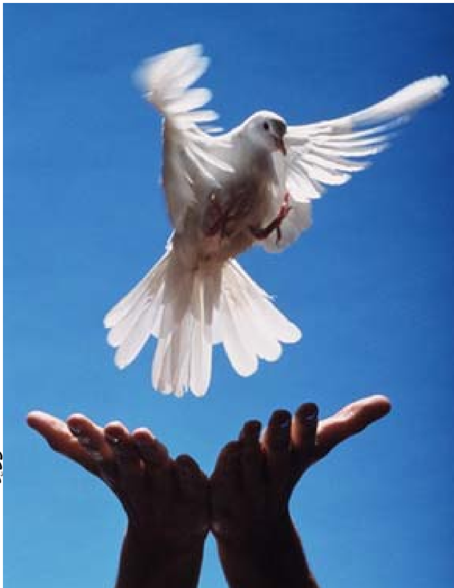
ئازادی، گهراڻهوهی سیمای راسته‌قینهی ژبان

دهروونییه‌کان به‌رتسه‌سک ده‌کرښه‌وه، ښه که‌سه تووشی ته‌پین (احباط) ده‌بیټ، واته له ښه‌نجامی فه‌شه‌لی زور و بی هومیدی، تووشی ښه و حالته‌ده‌بیټ، ښه فشاره زوره، پیویستی به به‌تالکرښه‌وه هه‌یه له رووی دهروونی، ښه‌میش له ریگای قسه‌کردن و گله‌یی کردن و ده‌برینی حه‌سره‌ته‌کان و گریان و توپه‌یی و ښه‌قینی کینه و بوغز، ښه‌گه‌ر ښه و به‌تالکرښه‌وه نه‌بوو ښه‌وا تووشی لادان ده‌بیټ، وه‌کو لادانی سیکی و له‌شفروشی و خو به‌ده‌سته‌وه‌دان و لادانی کومه‌لایه‌تی، وه‌کو گوښه‌دان به داب ونه‌ریت و ریساکانی کومه‌لگا، دزیکردن و کوشتن و ریگری و دژایه‌تیکردن و دژواری و لادانی دهروونی وه‌کو دل‌پاوی و که‌تابه و هیستریا تا ده‌گاته که‌تابه‌ی توند و شین‌و‌فرینا.