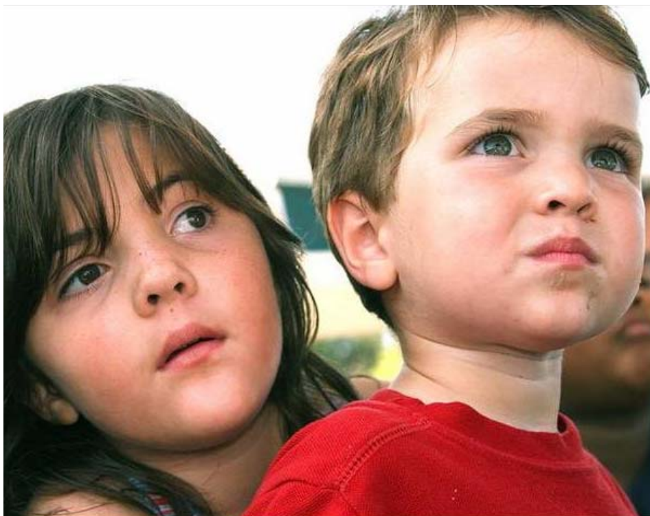
راهینانی نهوهی دادی لهسه ر گیانی پیکهوه ژیان..

مایه ی نینگه رانی بوو، که ماوه یه که سیاسیسه تمه داران و نووسه رانی ئیمه له میدیاکان قسه یان لهسه ر ئه وه بوو، که بنه چه ی تورکمان له بنه رته له تورکیاوه هاتوون و هه ندیکیشیان کوردن و خویان کردوته تورکمان، ئه مه تیروانینیکی نادرسته، چونکه هه رکه س ئازاده کورد بییت یان تورکمان، گرنگ لهسه ر ئه م خاکه برییت و بۆ ناسوده یی و ناوه دانی ئه م ولاته تییکۆشیت. کاتیک مرۆقیکی کورد مافی هه بییت بیته ئه ندای پهرله مانی سوید، ئه م مرۆقه به پیی یاسای ره گه زنامه ی ئه م ولاته، مافی هاوالاتی بوونی وه رگرتوو و وه که سیکی سویدی هه موو ماف و ئه رکیکی هه یه. کهواته لهسه رتاپای جیهانی