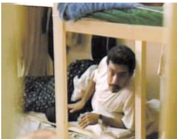
سیخوری، دروستکردنی پیاویک له گوپچه

له رۆژی یه که می سیمیناره که دا، کاتیکی رۆژه لاتناسیکی ئاکادیمی به ره گه ز ئەره مه نی، بانگ کرا بۆ وتار خۆیندنه وه، ئەو براده ره ی له ته نیشته من دانیشته بوو به ده نگی بهر ز هاواری کرد و گو تی: جاسوس و سیخور پیاوی میژووی نه، چونکه هه موو شتیکی به چاوی