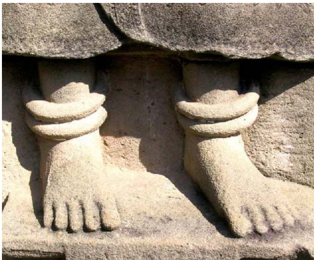
پېښه‌کان که دهن به بهرد، ژيان ده‌پېته کوتله‌ه‌کی وه‌ستاو