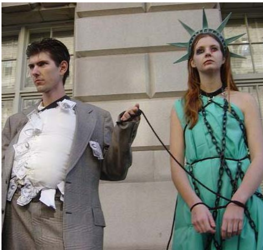
كۆيله بوون مرؤؤ دەكانە پەيكەرئىكى وەستاو