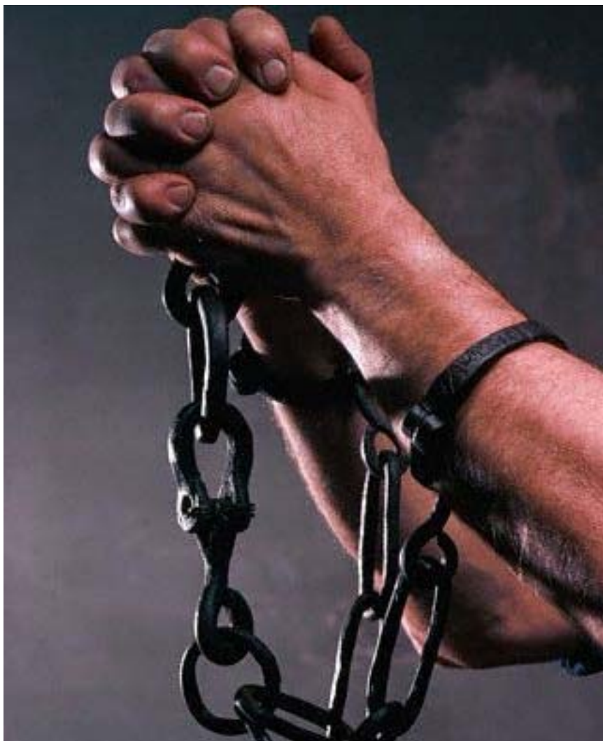
كۆپلەپتى ئۆزىن دەخاتە مەترسىيەو

پارەيسەكى زۆر كەم، يان بە زۆرى دەسەلاتەكانيان بە بى پارەش بەكار دەبردن، چونكە ئەو تاقمانە راھاتبوون بە ھەرپەشەكردن و دەرکردنى ئەو خىزانانەى كە بە پىي دەستوورى ئەو ناوچانەى مائە ھەژارەكانى تىادا زىندەكى دەكرد نەدەجوولانەو، بىگومان دوورخستتەوھى ئەو خىزانانە لە سەر زەوى و زارى خۇيان بە گەورەترىن سزا بۇيان دەپدرايەو، كاتى واش ھەبووھ دايك و باوكى مندالە ھەژارەكانيان بەو ھەلدەخەلەتاند، كە ھەر كاريك بۇ ئەم دەرەبەگانە ئەنجام بدريت، خوداى مەزنى لە جىھانەكەى دىكەدا بە خزمەت بۇيان دەپريتەوھ.