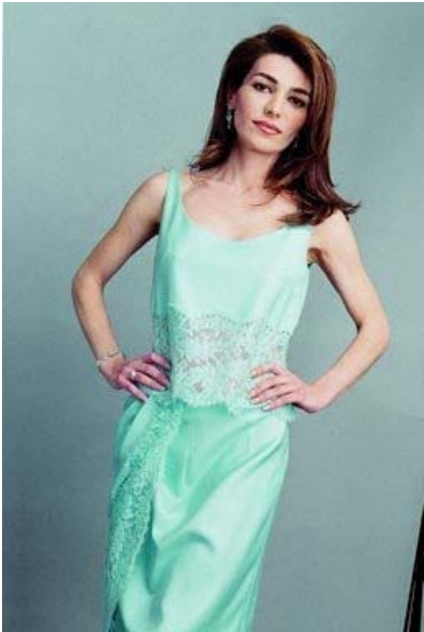
لەیلای کچی شا