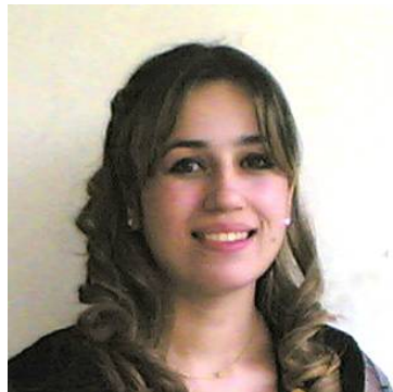
نا / ناشنا جه مال

نازانسی UPI ی نیو دهولته تی ، ماوهی ده سال جاریک جوانترین ریپورتاژو به دوداچوونی روژنامهوانی لهسهر ناستی جیهان هه لده بزیږی و له مالپه ره کهیدا له ژیر ناوی (به دوداچوونی درهوشاوه) بلاوده کاتهوه. ئه و ریپورتاژانه به جوانترین تهکنیکی روژنامه نووسی، یان جوانترین روداوو، که چاوی روژنامه نووس وینای کردبیت تهجامدراون. اکووارا ههم وهک کاریکی روژنامه نووسی، ههم له پیناو ناشناکردنی کادرانی نویی میدیای کوردی به هونه ری روژنامه نووسی جیهانی، له ههر ژماره یه کدا ریپورتاژیک له ئینگلیزیه وه دهکاته کوردی و بلاوی دهکاته وه، به و ئومیدهین هم پینگافه سوود بهخش بیت.