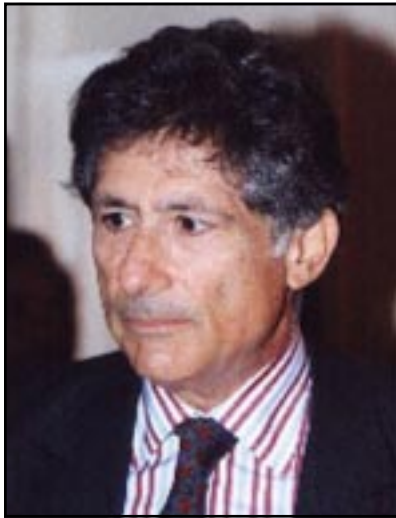
نیدارد سه عید

به درێژایی ۱۸ سال ته نیا دروشمه کانن توانیویانه زۆر جار له سهه ری ناستی خواسته کانی هه له بجه وه بن، هه له بجه شاری شه هیدانه، لانه کی میژوو، دلی دنیا ی هه ژاندا، ناسنامه ی کورده، هه موو کالایه کی جوان لایه ق به بالای هه له بجه به، ... هتد نه مانه و هه زاران دروشمی تر بۆ شاریک که ئیستاش و بیرانه ی له ناوه دانی زیاتره نهو قسانه ن که ورده ورده گومان و په ستیبیا ن له لای خه لکی شار دروستی کردوه که هه موو نهو پرۆژانه ی له ئاینده دا ده کرتین بریتین له پرۆژه یه ک له دروشم، ناکرت به خاوه نی ۱۲ شه هید بلتیت هه موو کالایه کی جوان لایه ق به بالای هه له بجه به و نهو ی خاوه ن نه و نه ده شه هید له که لاهه دا بژتیت، چی به