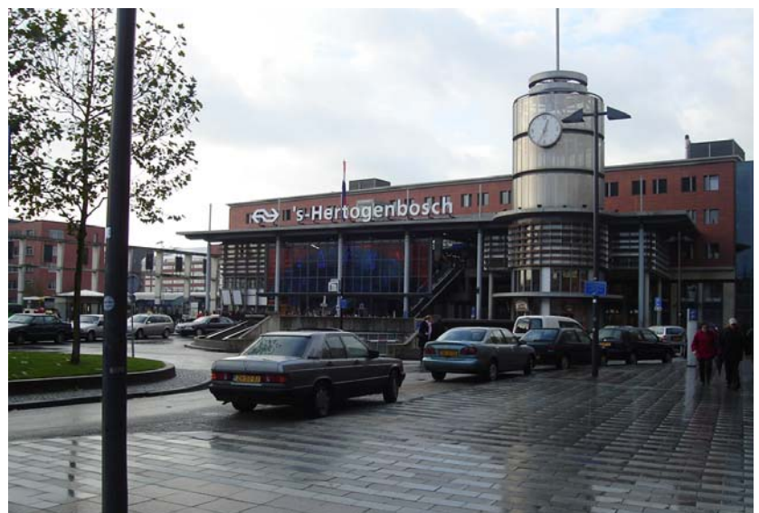
بە کامپرای نووسەر

لەوئ ئیوارەیی ھەینی دەست لەکار ھەلدەگرن، شەو خۆیان بۆ رۆژی شەممە نامادەدەکن، شەممە کە یەکەم رۆژی پشمووی ھەفتەییە تەرخان دەکەن بۆ سەردان و گەران و بازار و گالتە و گەپ و یاری و رابواردن و سەرخۆشی و خۆ لەبیربردنەوہ، چونکە ھەفتەییە کاریان کردوہ و ماندووبونە، رۆژی یەکشەممە کە دووھم رۆژی پشمووی ھەفتەییە نەریت وایە ھەر کەس لە مالی خۆیەتی، خۆ شووشتن و نووستن و خواردنەوہ و خویندن و ھەسانەوہ، ئەو بازارە گەورانە دەبینی (چۆل و ھۆل) ھ ریزەیی دوکان کردنەوہ (1.5) ھ ریزەیی ھاتنە دەرەوہ لە مال (5.5) یە،