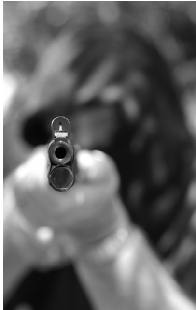
چه‌ک... دوژمنی سه‌رسه‌ختی مروّڤ کۆوار

نوممه‌ی ئیسلامی له چه‌ندین هه‌لوێستی زۆر ناله‌بار ئیهمه‌یان به‌ ئەنتی خۆیان زانیوه و له‌ قسه‌ی شه‌ر به‌ه‌ولاوه‌ قسه‌ی خێریان ده‌رحه‌ق به‌ ئیهمه به‌زاردا نه‌ها‌توه " ئهو له‌هه‌جه‌یه‌ی ((نجاح الطائی)) پێی دواوه، ئەکری به‌ ئاسانی له‌نیو فه‌ره‌نگی هیژه‌ توندپه‌وه ئیسلامیه‌کانی غه‌یری عه‌ره‌بی بدۆزینه‌وه، له‌نیویشیاندا ئیسلامیه‌کانی لای خۆمان، که‌ ئه‌وه‌نده‌ی له‌ خزمه‌تی ئه‌و ئاراسته‌یه‌دا