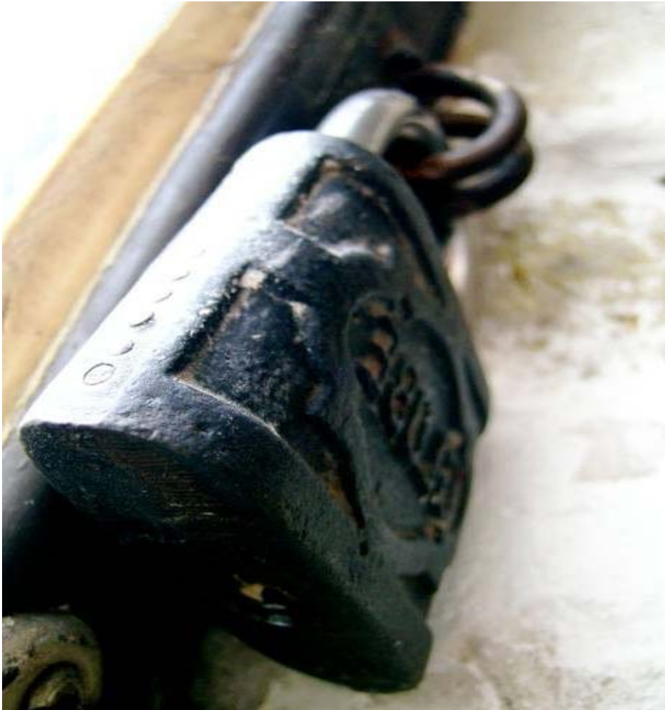
نەوہەیک لە چاوەروانی کرانەوێ دەرگا داخراوەکان کۆوار