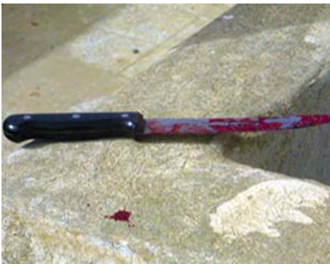
چەقۆ.. مۆديليکى ترسناکى تيرۆر کۆوار

لەو باسەدا ئيمە دەمانەوى قسە لەسەر کۆمەلگای خۆمان بکەين و