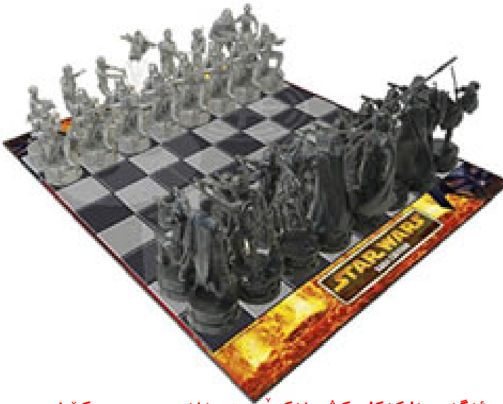
ئهگهر مهلیکهکان کش نهکرین، دهبهنهوه کووار

حکومهته نادیموکراتیییهکان لهرووی کردارییهوه پییان وایه