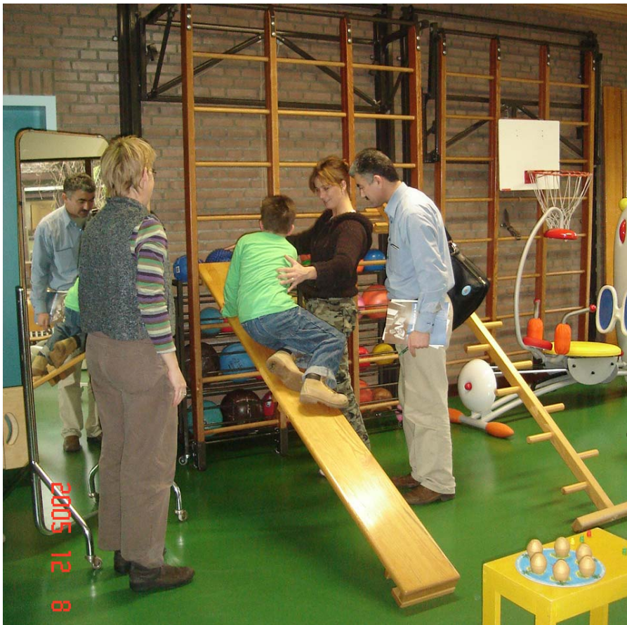
سه‌ته‌ری راهینانه‌وهی (Mytyl School)

ویستگه‌یه‌کی دیکه‌ی کارم له‌ هۆله‌ندا چاوپێکه‌وتن بوو له‌گه‌ل سیامه‌ند به‌نا بالوێزی عی‌راق له‌ هۆله‌ندا، له‌ شاری لاهای من و که‌سه‌یه‌تی ناسراوی هۆله‌ندی