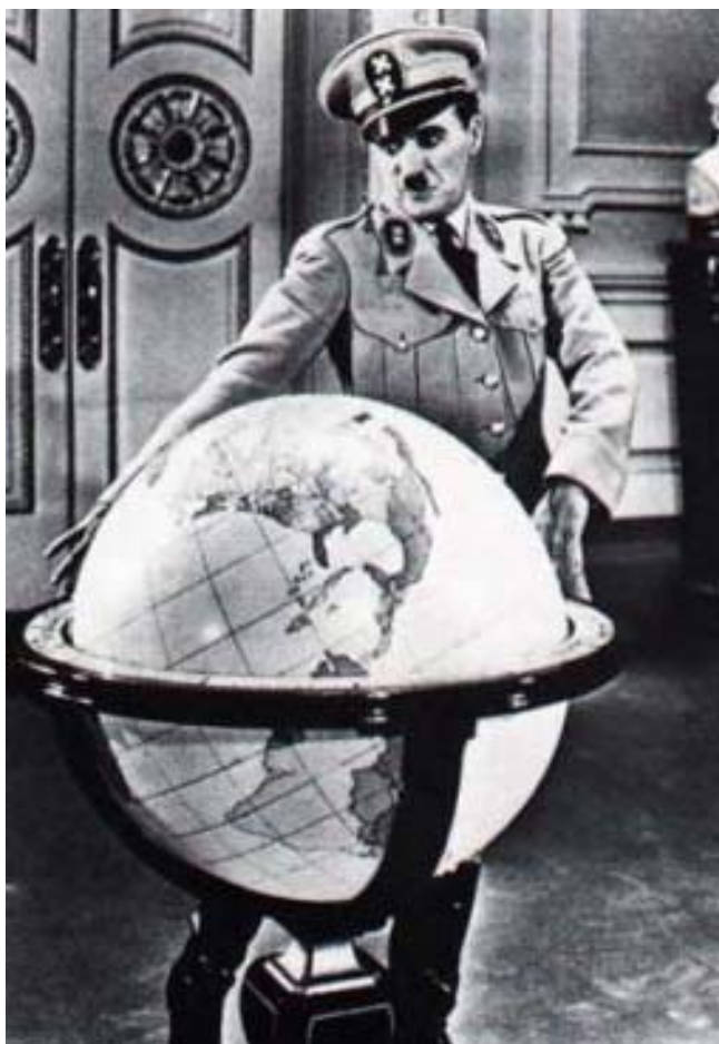
هیتلر سمبولی دیکتاتوری له دنیا کۆوار

حیساب نه‌کردن بو رای گشتی و رای جیا‌وا‌زو داخستن و کۆنترۆلکردنی سه‌ر له‌به‌ری سه‌رچاوه‌ ئابوورییه‌کان له‌لایه‌ن حیزبه‌وه، یه‌کیکه له‌ ئه‌خلاقه دیکتاتورییه‌کان و سه‌رکو‌ت‌کردنیک‌ی شارستانی و