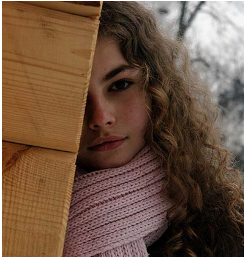
خەون بېنين بە ئايندە.. كۆوار

ئاواتەكان بەھيئەتتەدى، بەلام پروپەرووى كۆمەلەك كېشىنى ئابوورى، كۆمەلەتتە، سىياسى، پۇشنىبىرى (دەبىتتە، ناتوانىت بۇ سوود وەرگرتن يان ئەزمون وەرگرتن لە پابردوو چاوپىرېتتە ئايندە. ئەمەش پەيوەندى بە خودى ھۆشيارى و پۇشنىبىرى كەسكەو ھەيە، كە تا چەند دەتوانىت ئەزمون لە پابردوو وەرېگىت. ھەرەكەت لە سەرەو بەسما كىرد، نەبوونى بەرنامە و ھۆشيارى كۆمەلەتتە لەناو كۆمەلگە وادەكات، تاك ھەلەكان دووبارەبكاتەو ھەستىان پى ئەكات و خۆى لىيان نەپارىتت. سەبارەت بە كاركردى تاكى كوردىش بۇ ئايندە و تىروانىنى بۇ داھاتوو لەم بارەيەو ناتوانىن بلىين بۇ ئايندەكار ناكات، بەلام بە شىوہەيەكى كەم، ھەمىشە بە داوى ژيانىكى تەقلىدىدا دەگەپتت و ژيانى تەقلىدى كارىگەرى زياترى لەسەرە)