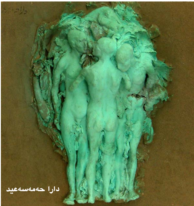
دارا حه مه سه عید

سه بارهت به کارکردنیشیان ده کریت به ناسانی لهیه کتر جودا بکریته وه، چونکه جۆری تهکنیک و قول بونه وه له بابته و ماتریالی کارکردنیاں جیاوازه، ئەم جیاوازیهش هاوته ریه، ئەزمون و پرۆژه هونه ریه که دهوله مند تر دهکات، یاده وهی و پاشخانی فکری هونه ریه نیش هۆکاریکه بۆ زیاتر نزیکبونه وهی له دهقی سه رهکی و ئەو بابته تانهی