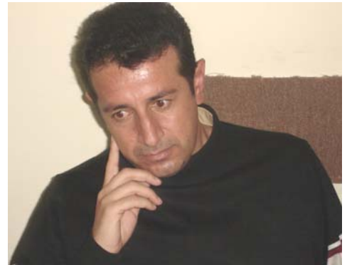
سه عدوللا برايم خان

په گڼگڼه له گوتاره سه قهته کانی سهر گوره پانی سیاسي ئیستای کوردستان، یاریکردنه به کونهستی نه وهی نوږ و ناراسته کردنیته به ره و گوتاریکی تا ناستیک نه نارشیزمی، به وهی که دهیانه ویت نه وهی نوږ بکنه پردیک بو په پینه وه له دونیایه کی ئیستاتیکاره بو دونیایه کی نه نتي ئیستاتیکا، واته پوله تیک.