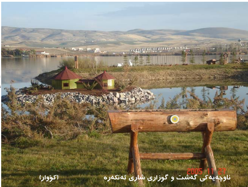
ناوچه یه کی گه شت و گوزاری شاری ئه کته ره (کۆوارا)

هه رچه نده گۆرانیکی خیرا به ریژه یه له رهوشه که، لایه نگرانی PKK و وه ک سه رلیشیواو ها تنه به رچاو،