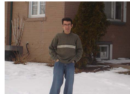
روژاني تورينتو 14 ل