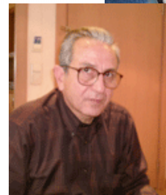
تهوانه ي دهو روبه رم به كوردي.. 40 ل