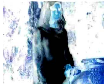
تافرهت و راگه ياندي كوردي.. 11 ل