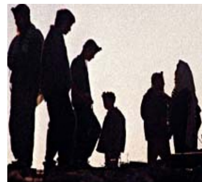
پياوي ماقول و پياوي.. 43 ل