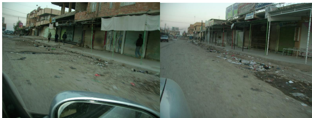
همان شوین له 2006