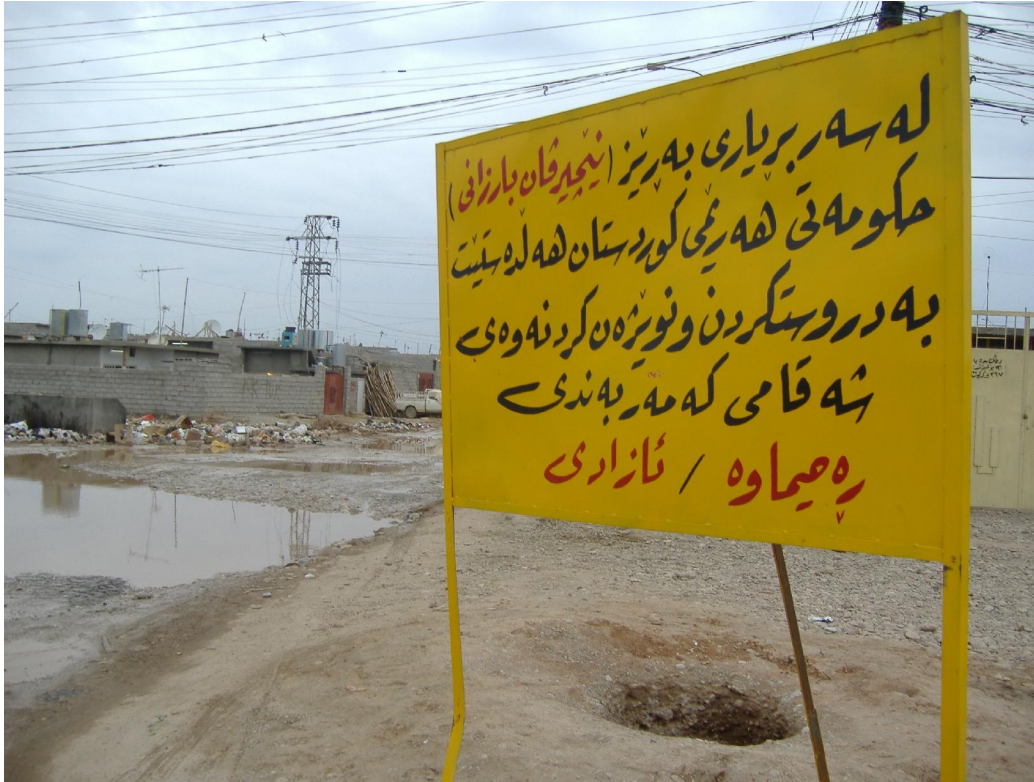
جاده‌ی په‌حیماوه نازادی سالی 2005 ، په‌کێک له موجدزاته هه‌ره گه‌وره‌کانی حکومه‌تی هه‌ولێر له که‌رکوک ، له پال به‌خشینی 10000 دۆلار به‌ ماله به‌ پارتی کراوه‌کانی بان سالی‌یی که‌رکوک