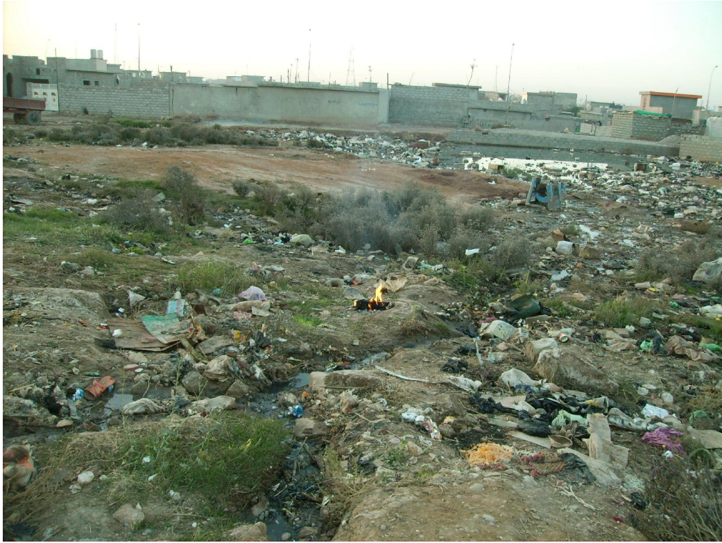
همان شوین له 2006