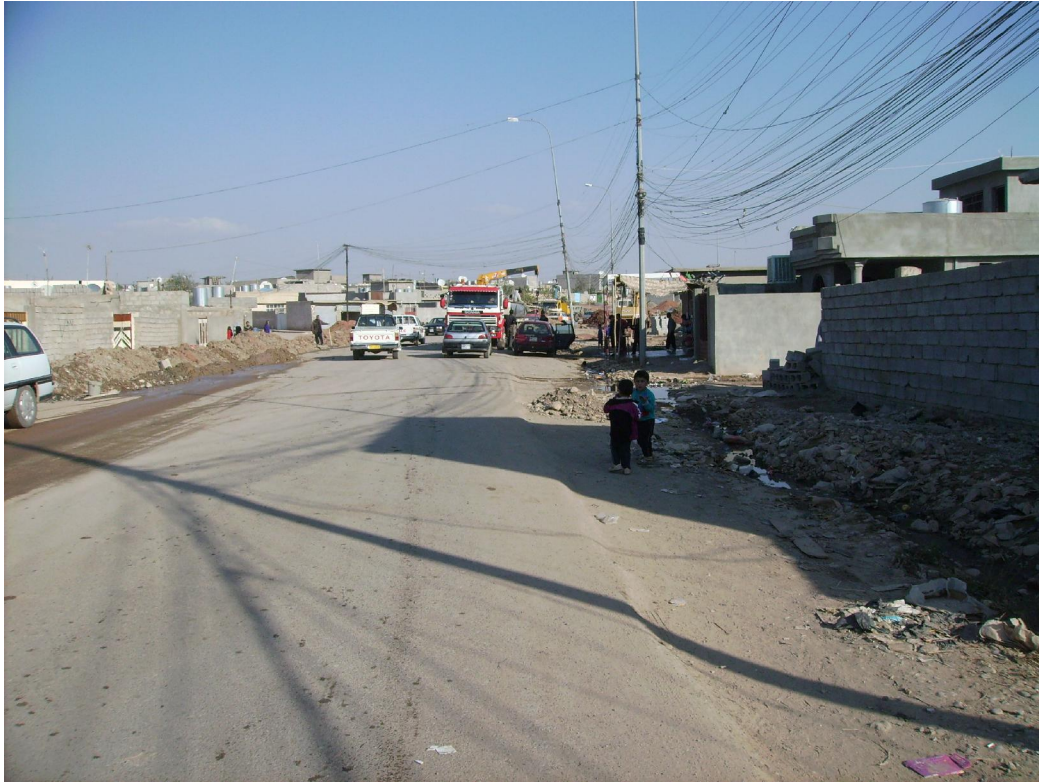
همان شوین له سالی 2006 ، هیشتا ته او نه بووه ، هه لده قه نریته وه بی لیدانی زیږاب ، گرنګ پاره خواردنه به ناو ئاوه دانکردنه وه ی که رکوکوه .