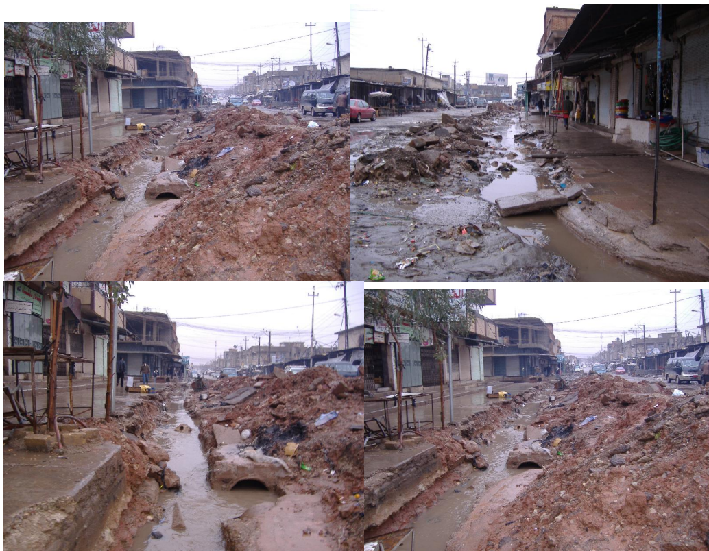
بازاری که وره‌ی په‌حیماره له 2005