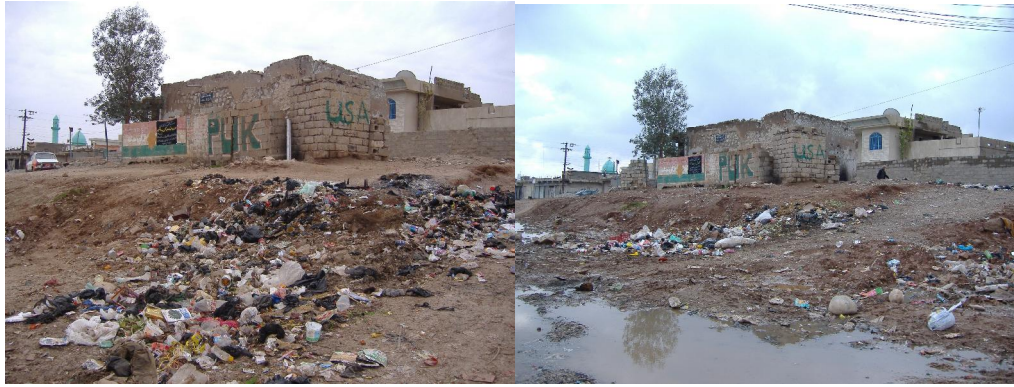
وینہی سالی 2005