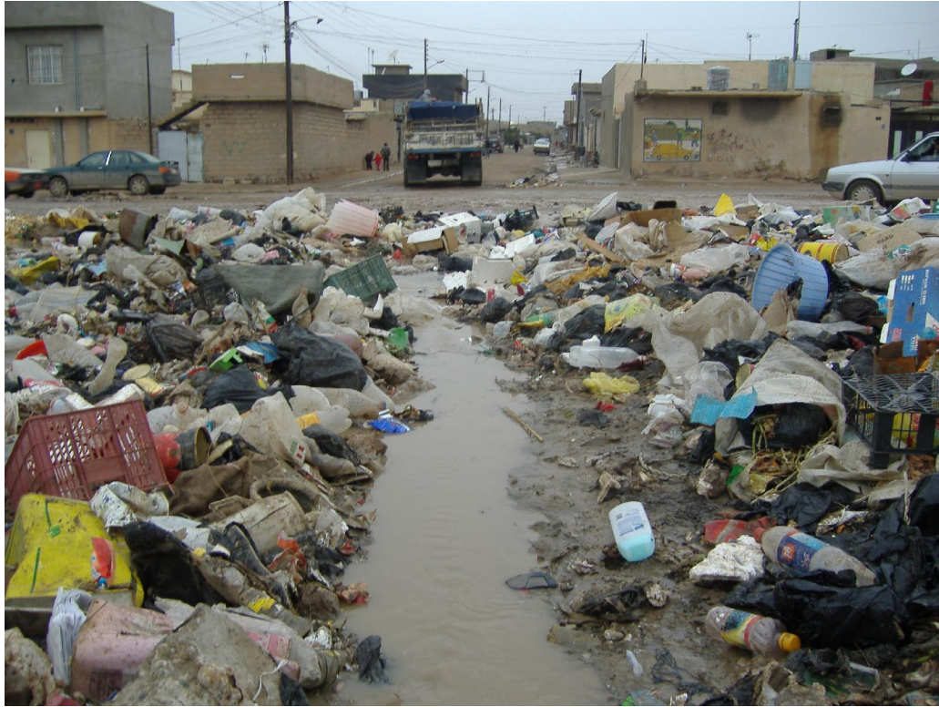
یه کیچ له زیلدا نه کانی په حیماوه له سالی 2005