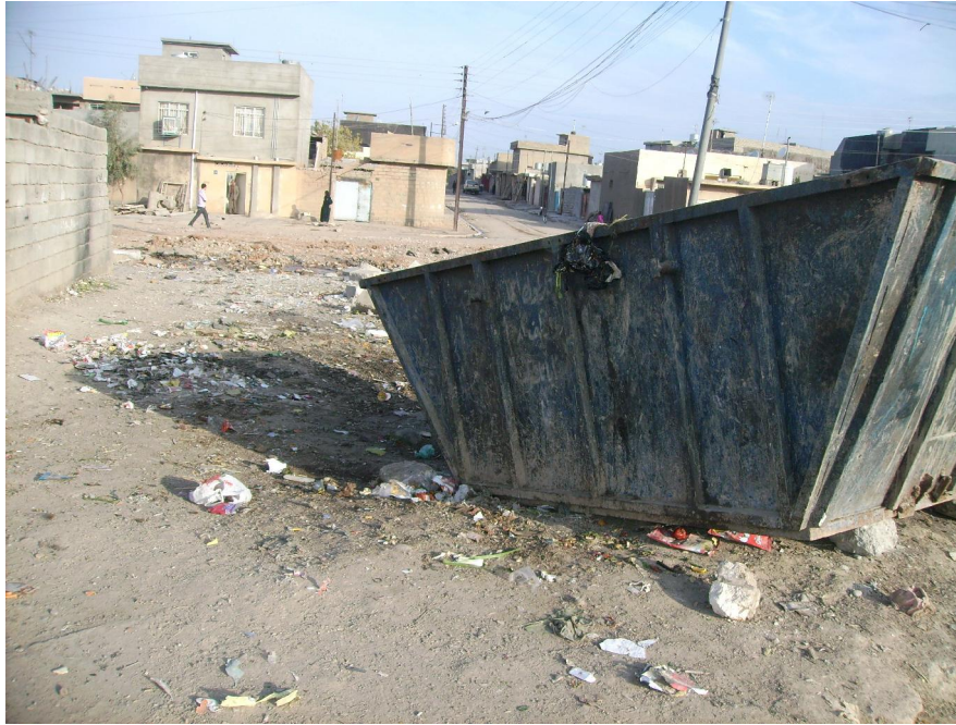
همان زيلدان له سالی 2006