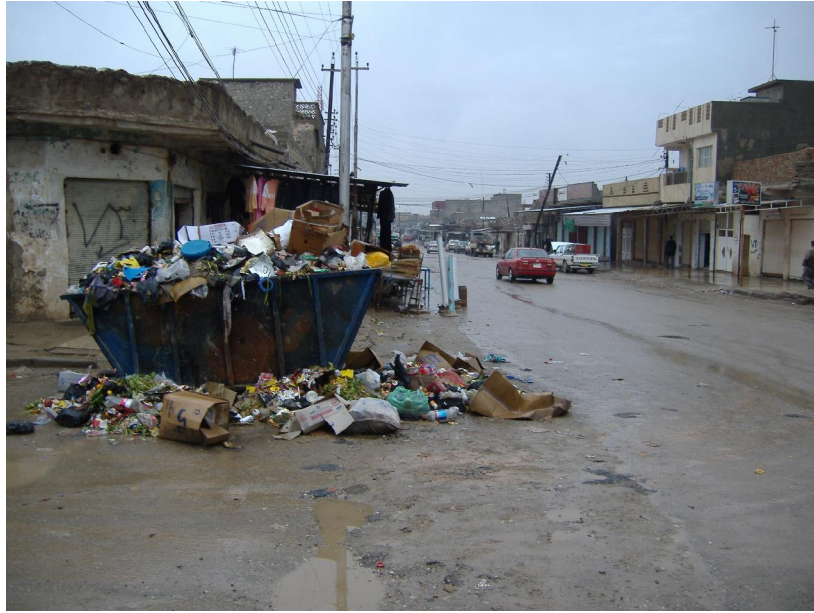
همان بازار له 2005