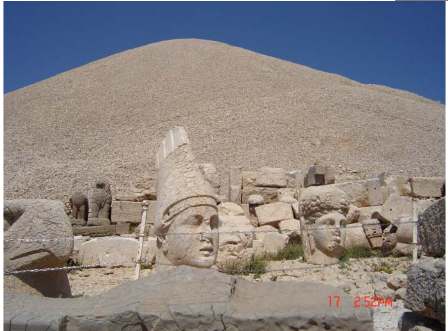
شوینه واری نه مروود

همان رۆژ به رهو شوینه واری نه مروود به ریکه وتین، که ده که ویتسه 90 کیلومه تری باکووری رۆژه لاتتی ئهو شاره، له ریگادا چالآوه کانی نهوت سه رنجیان راکیشام، لام سه یربوو له کوردستاندا نهوت هه بیټ، به لآم دوایی بۆم ده رکهوت، به ده یان چالی نهوت و به سه دان چالییش له شاری باتمانی باکووری کوردستان هیه، به لآم راده ی به ره مه کانیا ن زۆر که مه، بۆ نمونه رۆژانه ته نیا 200 به رمیل نهوت له چالآوه کانی نادیمان به ره مه دیت. چیا و دارستانه کانی زۆر به چیا و دارستانه کانی ده ور به ری سوژان ده چوون، داری مازوو و به پروو و داره به ن، که م و زۆر وه به رچاو