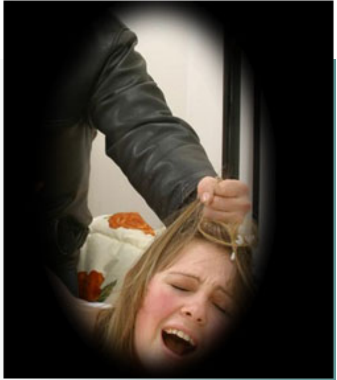
ښوونځي که له زما ني توندوتيزي، زما نيکي تر نازانن ..

ده تواني چاره سه ر بکريت، ښوونځي پرگار بوونه له و بوشيا يانه ي که له ياساي ته شريعيدا هه ن، که ريگا به کوټايي هيټانې حمله ښوونځي له ماوه ي دوازه هه فته تا بيست هه فته، ره گهړي کوړپه ش له هه فته ي دوازه دا ښوونځي دابنريت، پيوسته ياسايک دابنريت که تييدا ښوونځي له باربردن به تاوان دابنريت، که له هه فته ي دوازه هه مي حمله تا هه فته ي بيستم ده کريت، به ريگه يه له وانه يه بتوانين کوشتنی ميپينه رايگرين. (دراجش کومار) نو سه ري ليکوټي نه ودي (لانست) ده لیت: ليکوټي نه ودي که تر، که به راستي جيگاي گرنګي پيدانه ښوونځي، خه لک بروي ابوو که ته نيا چينه نه فام و نه خو ينده واره کان و خه لکيکي هه ژار و که م دهرامه ت موماره سه ي کوشتنی کچه منډاله کانيان ده کن، به لام ښوونځي ئيمه ښوونځي کرد پيچه وانه بوو، موماره سه ي کوشتنی منډالی کچ، له نيو چيني خو ينده واره دا زور خراپتره له خه لکي تر!!