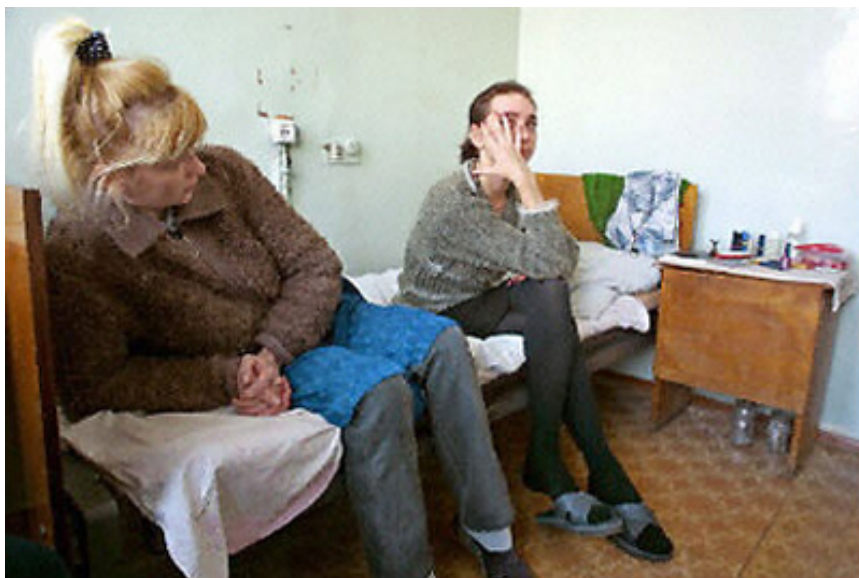
ئايدز.. ترسناكترين مهترسى سهردهم

ئاكارى چاك له گه نجداء. چونكه ئه و مندالانهى كه له بارىكى خيژانى ناسه قامگير ژيان به سهر ده بن و به رده وام موماره سهى كاسييت و فيلمه و روژينه ره سيكسيه كان ده كهن، به بى بوونى چاوديرى خه مخور، له ماله وه و كومه لگا به ريژهيهكى زياتر تووشى لادان ده بن، ئه مهش به هوى نه بوونى هوښيارى و گوئ نهدان به ئاكامه خراپه دهروونى و جهسته يى و كومه لايه تيبه كانى ئه م كاره. به پيى ناماره كانيش دهركه وتوو ه ئه و كچانهى ته مه نيان له نيوان (15-19) ساليدياه له كومه لگاي ئه فريقي، به ريژهى شهش ئه وه ندهى كوراني هاوته مه نيان دوو چارى ئه م نه خوشييه ها توون. چاوديرانيش هوكارى ئه م ديارديه بو ئه م ليشاوه هه ژارييه به ربلآوه دهگه پيئنه وه، كه رووبه پرووى ئه و كومه لگايه بوته وه. ئه نجامداني سيكسي ناشه رعى و جووت بوونى لايه لا، له زوربهى ولاتانى دونيا به ريژهيهكى وا ته شه نهى كردوو، كه بووه ته هوى ئه وهى لاوان به ريژهى 40% بهر له پيكه ينانى خيژان دوو چارى ئايدز ببنه وه. هه ر بويه بهرنامه ي قه ده خه كردنى سيكسي ناشه رعى و ريگه گرتن له گه نجان، له ئه نجامداني ئه م كرداره به تايبهت له ته مه نى 15-24 سالى به ريگا چاره بهكى بنه رتهى ده زانييت، بو گه راندنه وهى لاوان بو ژياني ناسايى و دووركه وتنه وه يان له ئايدز.