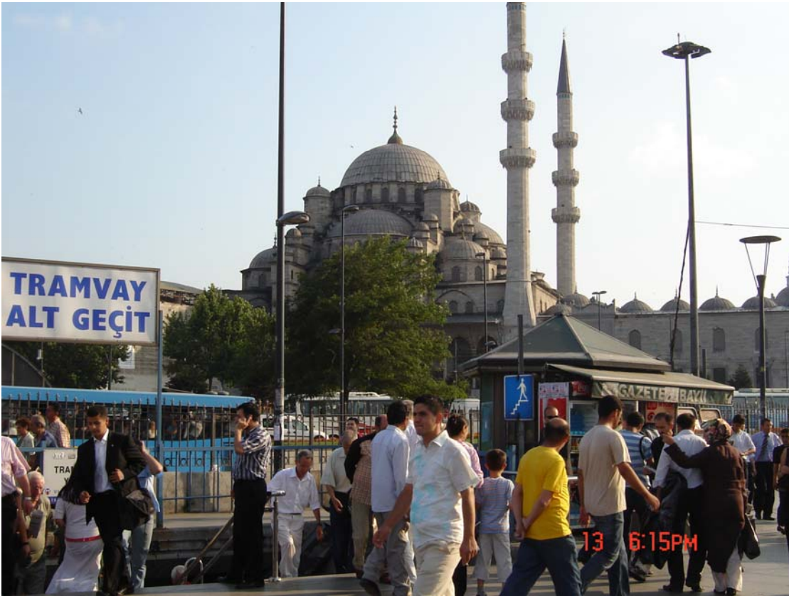
مۆزەخانەى ئايا سوڤيا

تايبەت كاردەكەن، لەهەر شارىكى ئەو ولاتە و هەر كاتىك بتەويت بە ريگاي كارتەكەتەوه، دەتوانىت هەم پارە بخەيتە بانك و هەم پارەى خۆت رابكيشى، بە نووسىنى ژمارەى نەيىنى ئەو كارتەى، كە پيشتر لەلايەن بانك بووت دەستنيشان كراوه. ئىوارەى رۆژى سيشەممە، بە فرۆكە بەرەو ئىستانبۆل بەرى كەوتم، دەرفەتى چوونە ئەنتاليا،