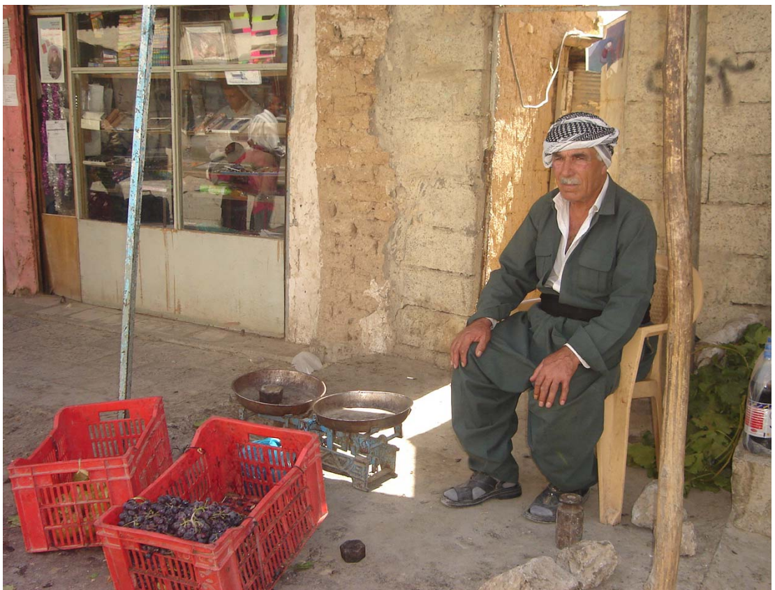
خدر جولا، كوره كه ی له مانگی ههنگوینیدا نه نغالکرا .. ئه مرؤش ئه و، نانی دهنستی خو ی ده خوات !!

بوون و نه بوون .. ته مه ن و نه جهل .. ژيان و مهرگ .. جاویدانی و فه نابوون، پرسیاری بهردهوام و هه میشه بی ولامی ئیمه ن، ئیمه یه کی مه ست له هیلاکی و ناسؤر .. پر له خه ون و ئازار .. تژی له سرسامی و گومان .. لیورپژ له خه م و برین. ئیمه یه ك، ته مه نمان به ته نها وهرزیكه وه به پیکرد و له رهنگه كانی سروشت چیژمان وهرنه كرت و وهرزه كان تیكه لی یاده وهریمان نه بوون .. ئیمه یه كه سه رایای ته مه ن و ژيانمان كوتله یه كه بوو له وهرزی وهرین، نه گه پری سه رله نوی چرو كردنه ومان بیینی و نه خولی وهرزه كانیش بردینییه وه سه ر سفره ی به هار، بویه سه یر نییه، كه هر له مندالییه وه هه ناسه پرکی و راکه راکه ی دواي گرتنی په پوله مان بوو، تا تیر بؤن به هه ناسه كانیه وه بکه ین، په پوله یه كه به و ته مه نه كورته یه وه ژيانی لیوانلیو بوو له بؤن و بهرامه و