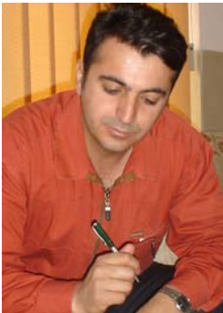
فه رزین که ریم

که واته له مه به ولا وریایانه، (من) له کانی خۆمان و خه لک بز میڤرین و کوټرلی بکه ین. خواجه بمانپاریزی له شه ری (من) له (من) له!!.