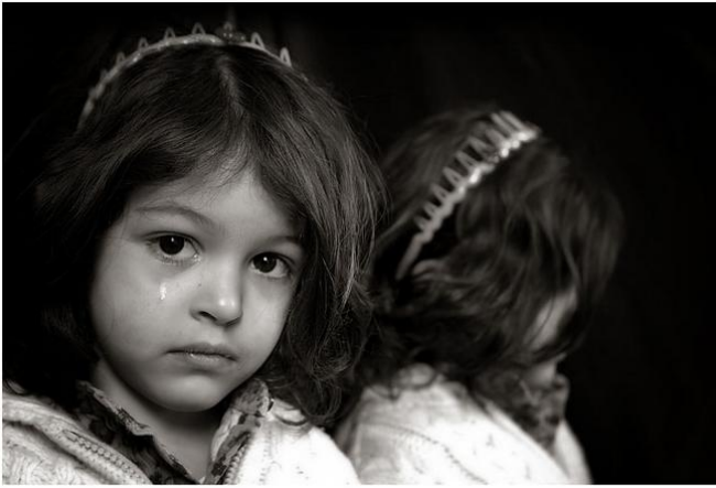
کوشتنی مندالی میننه.. ناشیرینترین تاوانی مروقابه تی

پوژنامهکان دهلیت: کیسه ییکی زور دروست بووه له په یادکردنی نافرته بۆ ماره کردنهوه، جا لهم حالتهدا زورچار کچ ناچار به زهواج دهکریت، ئەمهشیان لهوانهیه ببیته هوی توندوتیژی له دژیان، بهم شیوهیه بارودۆخی نافرته بهرهو خراپتر دهروات، لهوانهیه یاساکان له گۆرینی هندی بیرکردنهوهدا سهکرهون، بهلام ترسی ئهوه ههر ئەمینی که داب و نهریته ژهنگاویهکانی سهدان ساله بهسهریاندا سهکرهون و کوشتنی مندالی کچ ههر بهردهوام بییت، له هندی گوندو ناوچهی هیندیدا ژماره یئیرینه زور له ژماره ی مینینه زیاتر بووه. پسپوران لهو بروایه دان که له دوو دهیهی داهاتوودا، ئەگهر ههولنهکانی حکومت و چالاکوانهکان سهکرهون، لهوانهیه (70) ملیون کۆریه ی مینینه بکوژریت و ولاتی هیند لهو جوانی و هونهریان بی بهش بییت، که وهک هندی دهلین دونیای داگیرکردووه. (1) پوژنامه ی (سهندی ئیکسپریس) بلاویکردوتهوه، که له ویلاهیته (راجاستانی) هیندستان، ههرکه سیک خوشیکی نه بییت زور زهمهته نافرته ییکی دهست کهویت و بیینه خاوهن خیزان و هاوسهری ژیان، چونکه پیزه ی له دایک بوونی ئیرینه له زیادبوون دایه و له بهرامبهریشدا ژماره ی کچان روو له کهمی دهکات، که گه یشتوته راده ی (1000) کور بهرامبهر به (922) کچ، له هندی گوندی ناوچه که گه یشتوته (500) نافرته بهرامبهر به (1000) پیاو، ئەمهش وایکردووه باوکان کچی خویان نه دن به هیچ مالیک، ئەگهر ئەوان کچی خویان نه دن به کورکه ی ئەوان، واته ژن به ژنی .