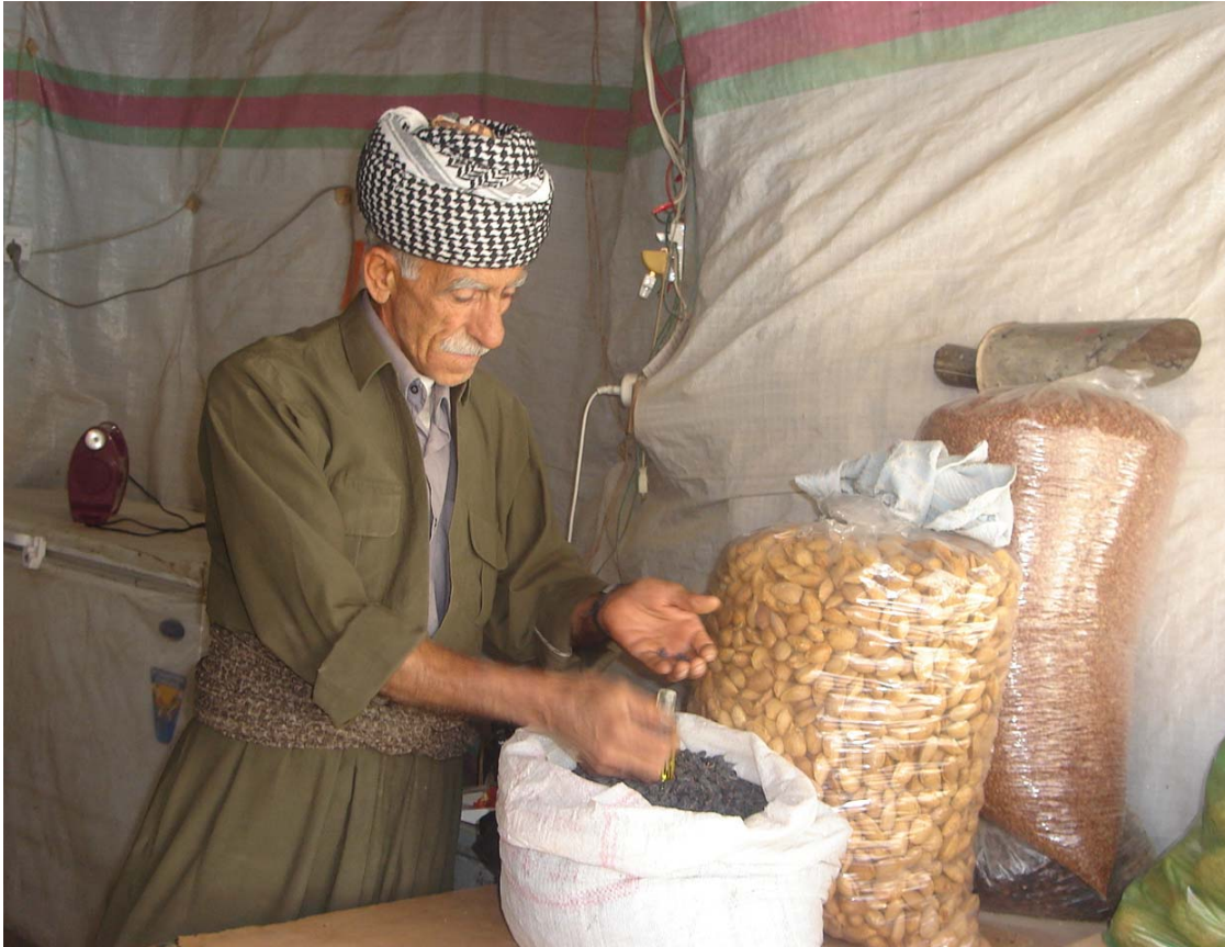
حه مه حمید، پیشمه رگه ی دیرین، به دم فروشتنی بادم و میوژه وه

(کازانتزاکي) گوته نی ((تاکو توانای سهر راوه شاندم بۆ هاوړپییانم هه بیټ و بهر له وهی بمرم، سالاویان لیکم و دهستی ته و قه یان بۆ درپښ بکه م و...)) له دهستان نایه، نه گینا هر یه کی کمان به و پیه پری تواناوه، تاو ده دینه کاتر میری مه چه ک و سهر دیواره کانمان و میله کانیان راده گرین، بۆ نه وهی هر