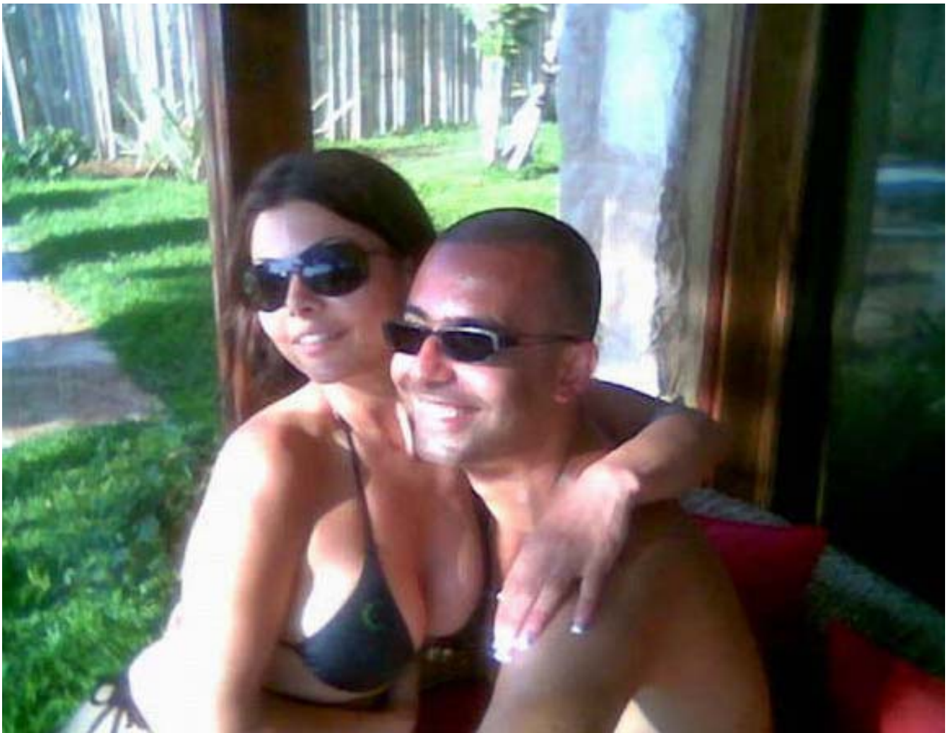
نهوهکانی سهدام و خوارزاکانی عودهی