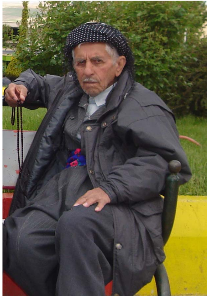
کەس بە قەد ئێمە لە مانای پیری و وەرزی گەلاریزان ناگات

ئەوێتر بەدیار قەرتارەیهک تری و سندوقیک تەماتە، ئەوی دیکە بە دەم گێرانی سینیهک بنیشتی کوردی، یەکیکی تر بەدیار رستی تەسبیح و چەپکی دارجگەرە، یەکیکیان لە بەرامبەر دەستیەک موس و چەند بسکویتیکی ئیکسپایەر، ئەمیان بەسەر مەچەکیەوه چەند جووتی گۆرەوی، ئەویان چەند دانەیهک گۆچانی بەلالوک و سەبەتەیهک قەزوان، نمایش دەکات... هتد.