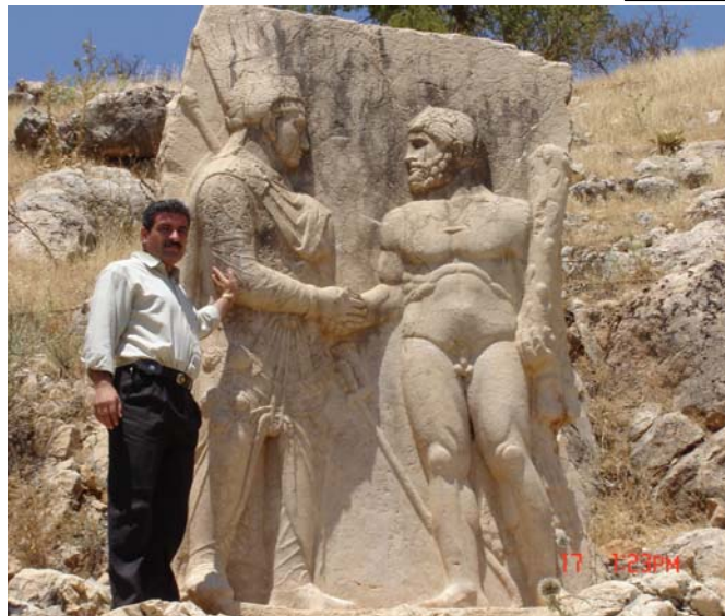
شوينهوارىكى ئاديامانى باكوورى كوردستان

قهلايهكى بهرز له ناوهندى شاردا ههيه، ههمو شارى ليوه دياره و له بهرد دروستكراوه، نهو شاره چونكه له قهراغ