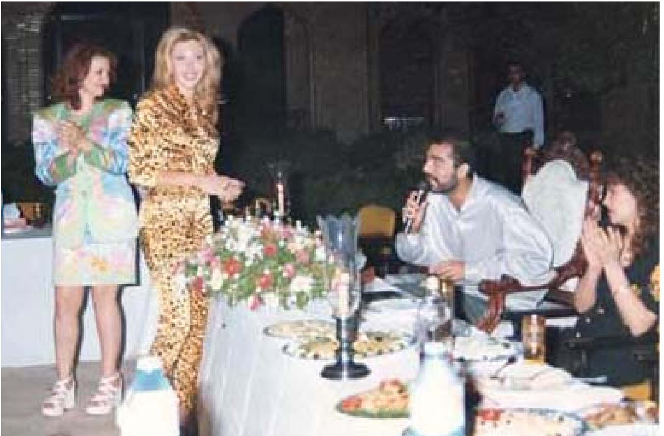
عوده‌ی، له‌گه‌ڵ گۆرانیبێژو پلنگه‌ مییه‌کانی!

ده‌یانتوانی رابه‌رایه‌تی هۆژیک بگرنه‌ ئەستۆ و شه‌جه‌ره‌نامه‌یه‌که‌ بۆ خۆیان له‌ چاپ بده‌ن، که‌ گوا‌یا له‌ وه‌چه‌ی عاره‌به‌کانی یه‌مه‌ن. عوده‌ی سه‌دام حوسین، که‌ تا سا‌لی 1996 به‌ جیگری باوکی ده‌هاته‌ ژماردن، که‌وته‌ ناو بۆسه‌ی عاره‌به‌ شیععه‌کانی پارێزگای عه‌ماره‌ و سه‌قه‌ت بوو. له‌ هه‌مووی گرنگتر گولله‌یه‌که‌ به‌ر ده‌ماریکی که‌وت، که‌ له‌ پیاوهرتی خست. ئەم رووداوه‌ له‌ شه‌قامی مه‌نسور روویدا، تا‌قمی ده‌ست وه‌شین له‌ تۆله‌ی شه‌هیدانی راپه‌رینی باشوور به‌م کاره‌ هه‌ستان، به‌لام هه‌ندیک پسپۆری تیرۆر گومانیا‌ن هه‌یه، که‌ ده‌سته‌یه‌کی شو‌رشگێری زه‌لکاوه‌کان، که‌ له‌لایه‌ن راهینانی سه‌ربازیی و ئەمنی که‌م ئەزموون، له‌ناو جه‌رگه‌ی به‌غدا ده‌ست درێژی بکه‌نه‌ سه‌ر پیاوی ژماره‌ دووی رژیمیکی ئەمنیی درنده‌، قامکیان ده‌خه‌نه‌ سه‌ر کیشه‌ی شه‌ره‌ف و وا هزر ده‌که‌ن عوده‌ی کچی بنه‌ماله‌یه‌کی خاوه‌ن ده‌سه‌لات و خاوه‌ن هۆژیکی