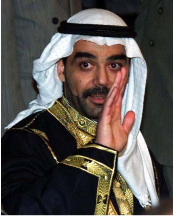
عودهی، لاسایی کهرهوهی میرهکانی کهندا

بووبیئت. هه رچه نده کۆریه که هه ر به بیژی دیته ژماردن، به لأم له وانیه ره گهزی مندال سامیی و عاره ب بیئت، نهک سامیی و جووله که. بازرگانی داماو به وه سزا ددری که پارهی خوینی کوژراویک بداته بنه ماله کی کچه که، کچه ش ددری تته پیره پیاویکی خزیمان، به ناوی حوسین ئهل مه جیدو سه دام له دایک ده بیئت، که به ره ه می جوله که یان عاره به، ئه و مه گه ر دایکی بیزانیت.