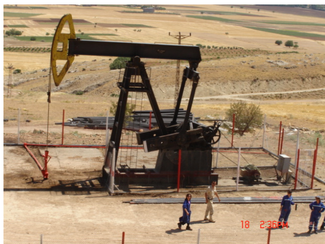
كانىكى نهوتى ئاديامان - باكوورى كوردستان

ميترو ترينى ژير زهوى هاتوچوى سانا كردوه، تاكسيهكان زوربهيان فياتى موديل نوين، نرخى گواستنهوه