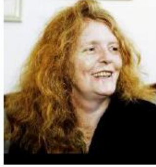
Kristina Lugn 1948

رۆژی پینچشمه کاتژمیر یه‌کی پاشنیوه‌رۆ ، نه‌کادیمیای سوید ، ناوی نووسه‌ریکی جیهانی راده‌گه‌ینی که خه‌لاتی نۆبلی سالی 2006 پیشکەش ده‌کریت . نه‌و نووسه‌ره جیهانی یه‌ چەند به‌ناوبانگه یان چەند کەس دیناسی ، نه‌وه هەر نه‌و کۆمیتە‌ی خه‌لاتی نۆبله وه‌لامی نه‌و پرسیارانه ده‌داته‌وه و نه‌و نووسه‌ره به‌ناوبانگ ده‌کات به‌ پیشکەش کردنی گه‌وره‌ترین خه‌لاتی جیهانی ، خه‌لاتی نۆبلی بو نه‌ده‌ب . نه‌مسال دوو نه‌ندامی نه‌کادیمیای سوید {nndsten sjostra} که له‌سه‌ر کورسی ژماره [8] داده‌نیشت و {lars gyllensten} که له‌سه‌ر کورسی ژماره [14]