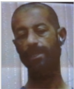
تیرۆریست وەستا فاریق