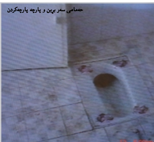
حەمامی سەربەینی و پارچە پارچە کردن