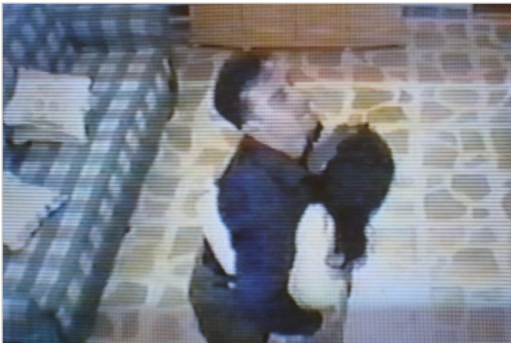
تیرۆریست ملازم دلیر:

پاش زنجیرەیک کاری تیرۆریستی نامۆزانی لە پایتەختی کوردستان هیزەکانی ناسایش و داموێزگا پەروەندیارەکانی پاراستنی سەقامگیری توانییان تۆزیک زۆر ترسناک و گەورە تیرۆریستی بەناوی تۆری شیخ زانا و هاوکارەکانی دەستگیر بکەن، سەرنج لەکارە نامۆزەکانی ئەو کورە بەدەن کە چۆن بەناوی نایین و جیهاد و حوکم کردن بە شەریعی خوا گەنجیان فریوادو و دواتر دەستیان کردووە بە سەربەینی خەلک و کاری سیکسی و تیربازی و مەشروب خواردنەو و ئەتک کردنی کچان و چەندین کاری قێزەوێتر کە دواجار هەر هەمووشیان بەناوی جیهاد و ئەرکەکانی موحامید و شەریعی خوا ئەنجام داو، «خەبات» بە زنجیرە لێدوانی ئەو تیرۆریستانە بە زمانی خۆیان و دەق بلاو دەکاتەو: