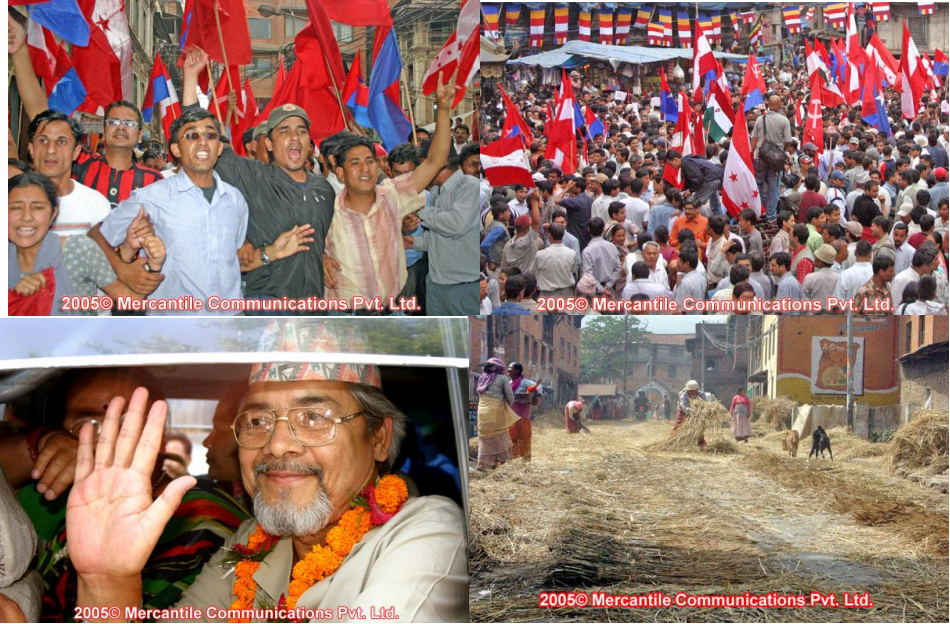
سەرۆكى پارتى كۆمۇنىست لەكاتى ئازادكردنى وسەرۆك وەزىرانى راپردوش