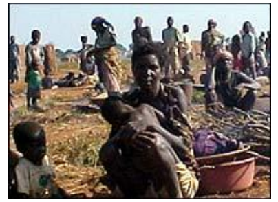
مناڤ و مەلارېيا

ئەمسال مەلارېيا 3 مىليۇن مناللى كوشتوۋە ، ئابورى زانى بەناو بانكى ئەمەرىكى (جىفرى ساتش) راي گە ياند ، ھەرچەندە تولە خىستەنە سەر جىگەى خەوى منالان تەنھا 5 دۆلارى تىدەچىت ، بەلام لەبەر ھەژارى نىيانە بىكپن . ئامارەكان رايان گە ياند لە جىھاندا 10,6 مىليۇن منال بە نەخۆشى سانا دەمرن .