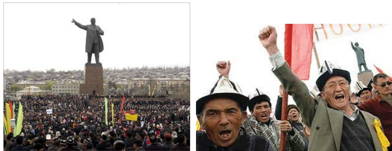
گەرەرىن كۆبونەوہى جەماوہرى لە ژېر تىمسالەكەى لىنېندا ئەنجامدرا .

ئەوہى من خویندەمەوہو بىنىم ، پۆژنامە كوردىيەكان بە شەوقەوہ ھەوالەكەيان وەرگرت ، شىكردنەوہى خۆيان لەسەر ئەو بنچىنەيە دا كە ئەمە دوا پۆژى ھەموو دەسەلاتىكى گەندەل و دكتاتور و بنەمالەييە ، وەك ئەوہى لە ناو ئەو پارتانەى پۆژنامەكانىيان ووتارەكانىيان بلاوكردۆتەوہ ، پىويست بە گۆرپانكارى نەكات ، ديموكراسى سەرتاپاى پارتەكەيانى گرتبىتەوہو ھەر چەند سال جارېك سكرتېر دەگۆرپت و ئابورى حىزب و وولات بۇ ھەمووان پونە و كەس و بنەمالە كۆنترۆلىيان نەكردبىت ، بەلام من دەلېم سەردەمى نوئ سەردەمى شۆرپشە خىراكانەو دەست نەكردەوہى دەسەلاتداران خەرىكە بىتتە نەرىتى باوو ، ھەژاران بەم شۆرپشانە ھىچ لە دەست نادەن ، بەلكە لە سەما بۆگول نزيك دەبنەوہ ، كوردستانىش لە رابونىكى جەماوہرى واوہ نزيكە ، بەلام رەنگەكەى جارې ديار نبيە .