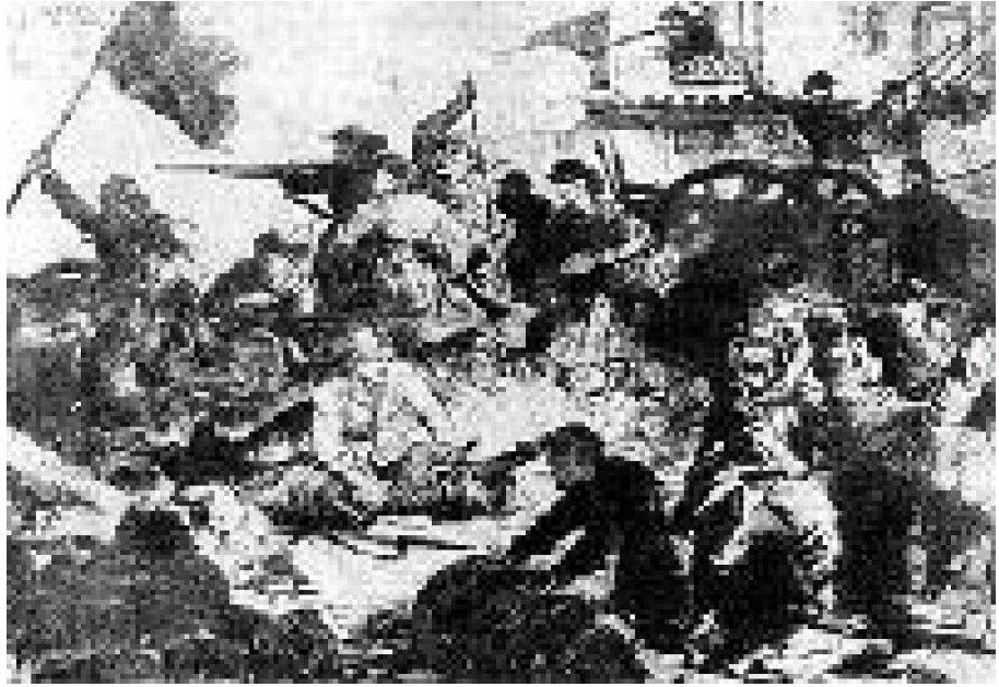
تابلۆيەك لەسەر كۆمۇنە