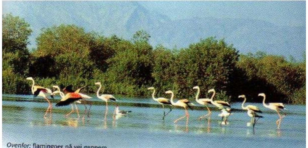
Ovenfor: flamingoer nå vei gjennom