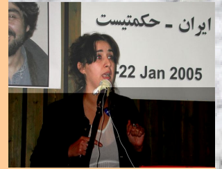
ناسک نه محمد

له 8 ی مارسدا ده بی روپه کی تری کومه لگای عیراق نیشانی دنیا بدهین .