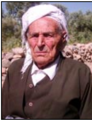
مه‌لا موچه‌ره‌م مه‌لا سه‌مه‌د

(فه‌روخ یان فه‌رح پاشا) بریاری پاشه‌کشه‌ ده‌دات بۆ ناوچه‌ی پشده‌ر تا له‌وی له‌گه‌ڵ (شه‌هره‌مان) ی برایدا له‌شکره‌کانیان بکه‌ن یه‌ک و به‌ر له‌و هه‌یرشه‌بگرن به‌هۆی خیانه‌تی یه‌کیک له‌ کورده‌کانه‌وه‌ فه‌روخ له‌وی شه‌هید ده‌کریت ئیدی له‌شکری بیگانه ده‌که‌ونه‌ تالانی ناوچه‌که‌.